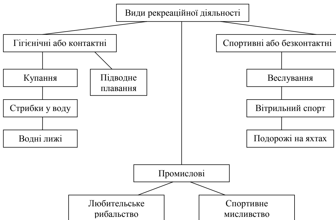
Рис. 1. Види рекреаційної діяльності на водоймах Українського Полісся [2]

Вимоги, встановлені до цільових показників характеристик озер щодо вищевказаних видів рекреаційної діяльності характерних для озер регіону, викладені у таблиці (табл. 1).