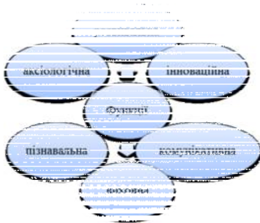
Рис. 1.2. Функції процесу підготовки бакалаврів з туризму до професійної взаємодії зі споживачами туристичних послуг

– оволодіння студентами комунікативними стратегіями для успішної професійної взаємодії зі споживачами туристичних послуг.