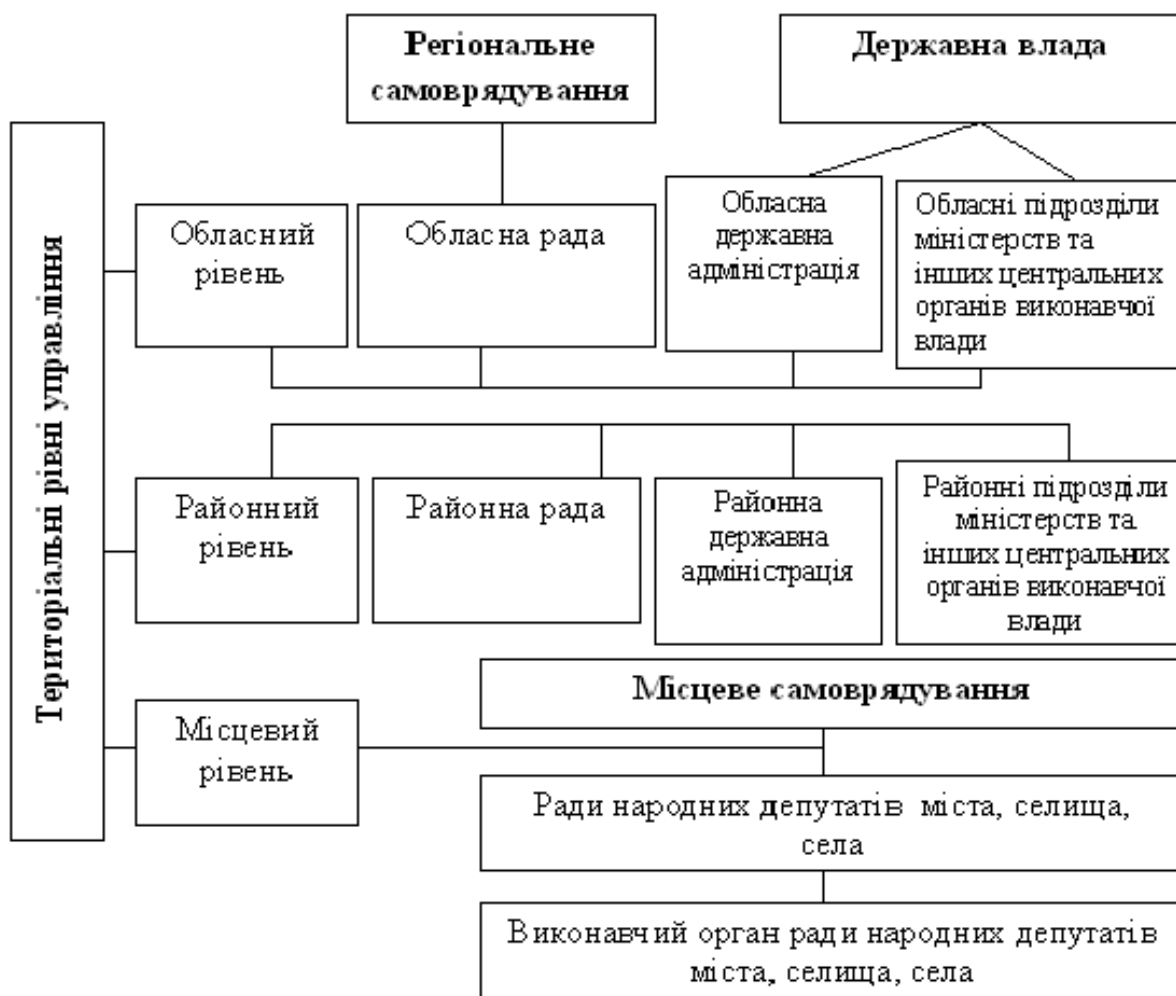
Рис. 1. Територіальна організація підсистеми владних інституцій Волинської області

Органами місцевого самоврядування на вищому регіональному рівні є обласна рада народних депутатів, на середньому – районні й міські ради народних депутатів (міст обласного підпорядкування) і на нижчому рівні – сільські, селищні та міські ради народних депутатів (рис. 1).