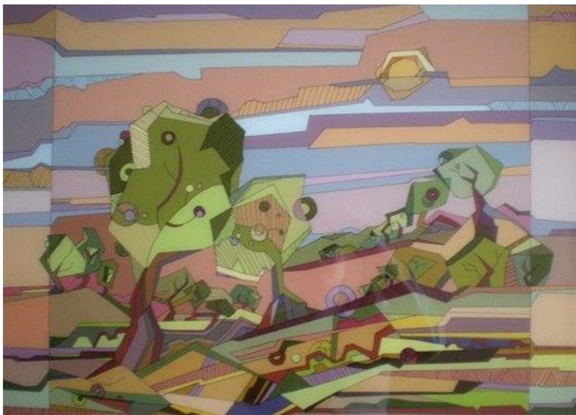
Курсова робота на тему «Обрії» Декоративне панно, 2014р. Скло, розпис.. 50x70. Вик. ст. Мельник Ірина