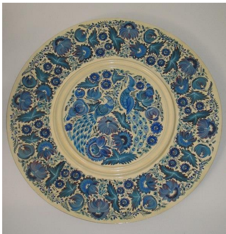
.Курсова робота на тему «Сині птахи». Декоративна таріль, петриківський розпис). 2013р. Д.35 Вик. ст. Лукашук Ольга