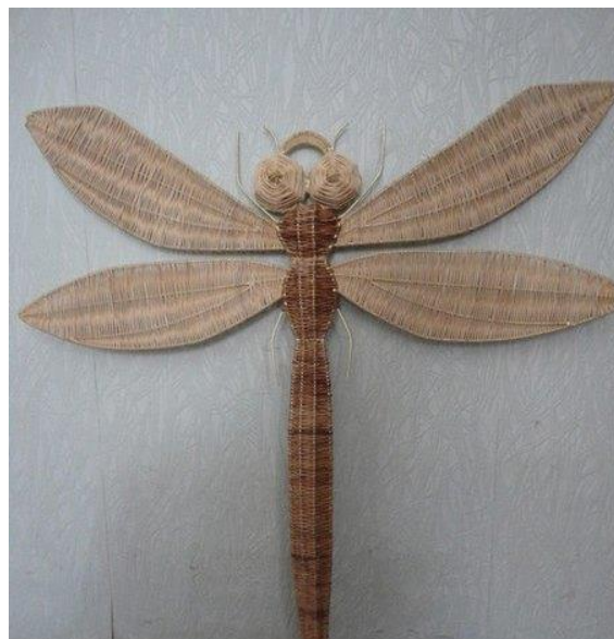
Курсова робота на тему «Вільний політ» (Об'ємно-просторова композиція, лозоплетіння). 2012 р. 70x80 Вик.ст. Довгополік Тетяна