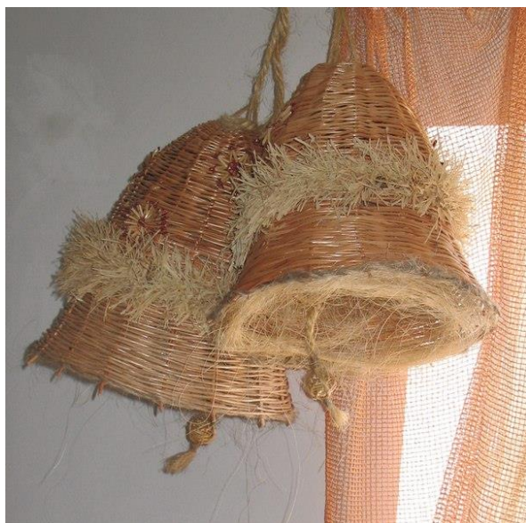
Курсова робота на тему «Різдвяні дзвони» (Об'ємно-просторова композиція, лозоплетіння). 2012р. 50x50 Вик. ст.. Беркета Тетяна