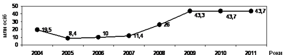
Рис. 2. Динаміка кількості біженців у світі 2004–2011 рр., млн осіб

З початку XXI ст. частка біженців поступово почала знижуватися і у 2005 р. становила 8,4 млн осіб. Подальша економічна криза призвела до швидкого та значного збільшення кількості біженців в усьому світі (рис. 2).