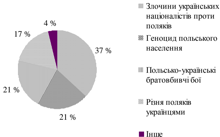
Рис. 2. Тракткування поляками подій на Волині у 1943–1944 рр.

Отже, майже всі поляки, котрим було відомо про трагедію на Волині у 1943 р., провину за ці події покладали на українців, а отож вважали останніх основними винуватцями трагедії.