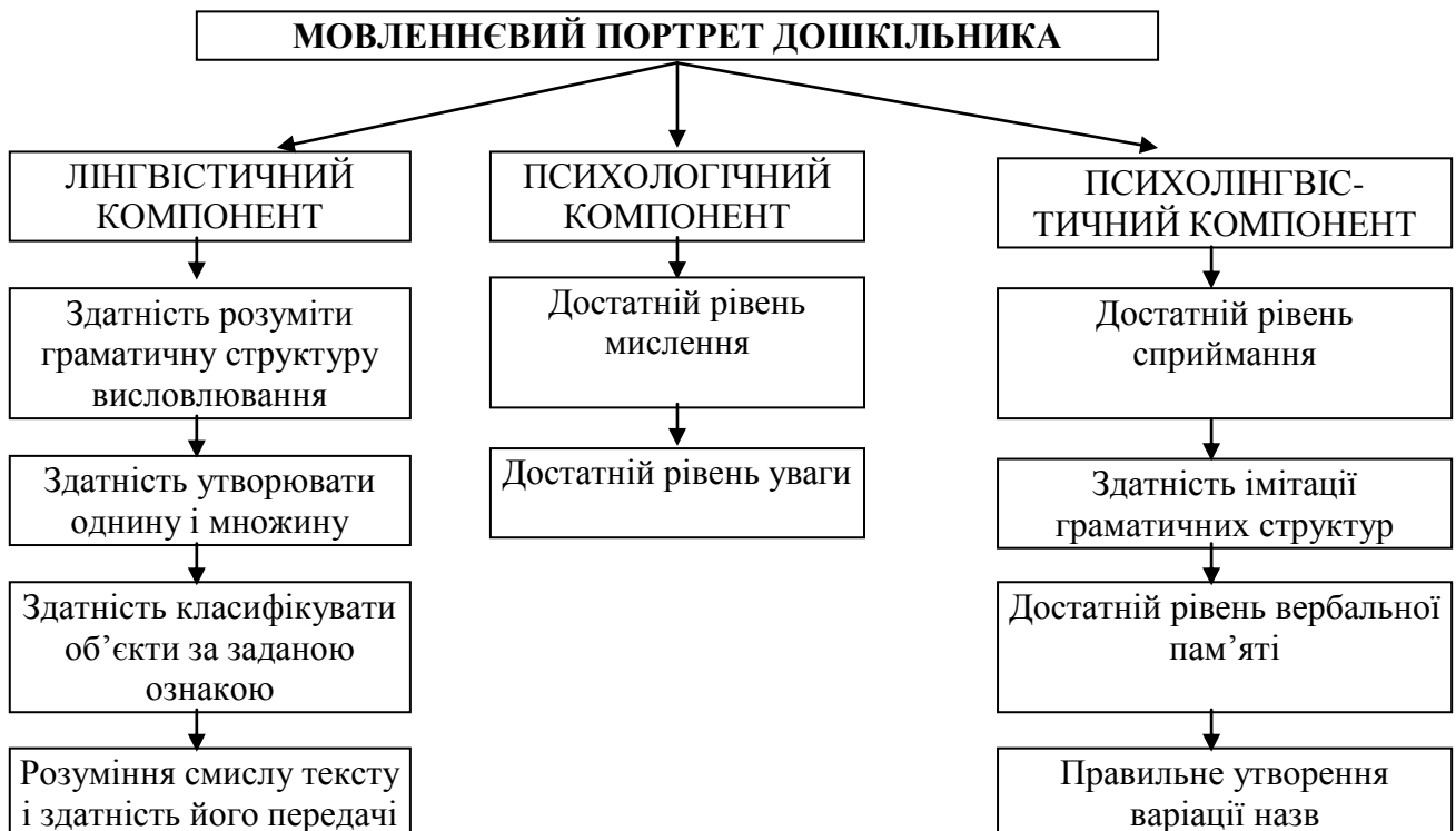
Рис. 2. Мовленнєвий портрет дошкільника

Виокремлення основних факторів дало змогу схематично зобразити компоненти мовленнєвого портрету дітей дошкільного віку (див. рис. 2.).