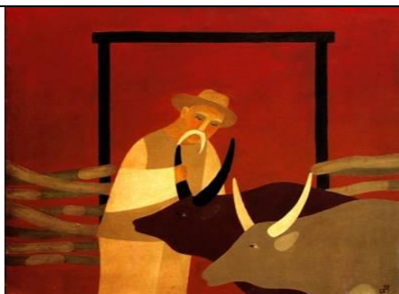
Олексій Потапенко. Воли мої.