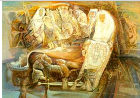
Григорий Краснов. Похорони вождя.