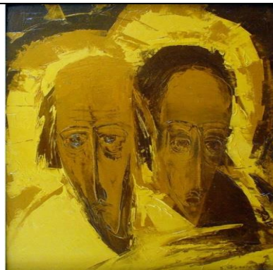
Валерій Франчук. Апостоли Петро і Павло.