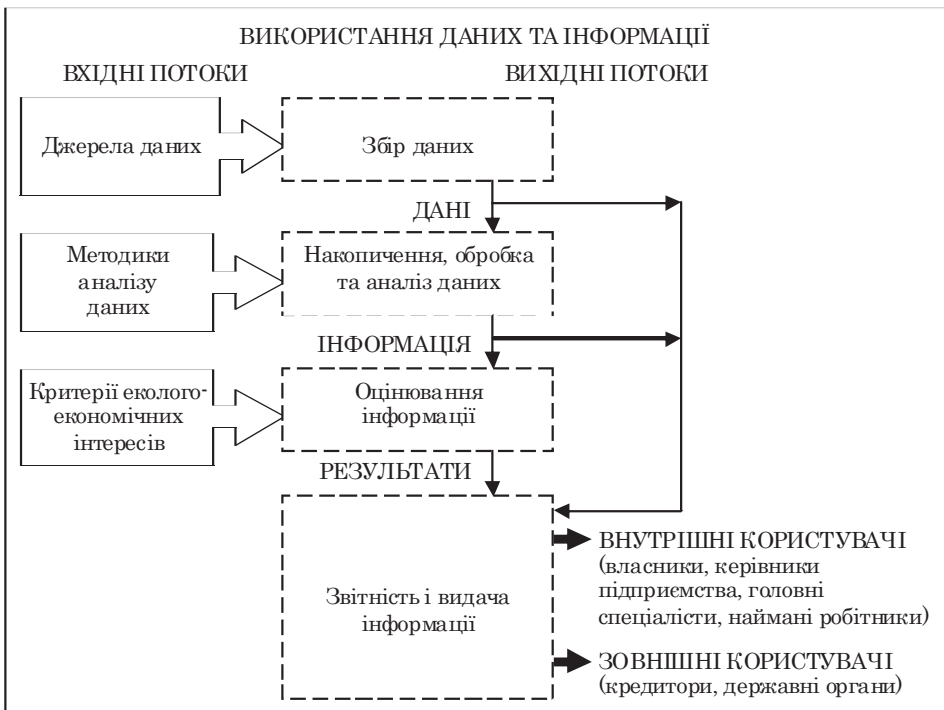
Рис. 3. Схеми використання даних та інформації, побудовано на основі [20]

4. Наявна внутрішня суперечливість еколого-економічні інтересів підприємства має компенсуватися загальними позитивними результатами діяльності. Такі інтереси підприємства, як позитивний екологічний імідж підприємства, виробленої продукції або послуг, збільшення обсягів виробництва, підвищення якості продукції, що не мають практичних механізмів порівняння мають визначатися на основі оцінювання їхнього впливу на кінцевий процес відтворення.