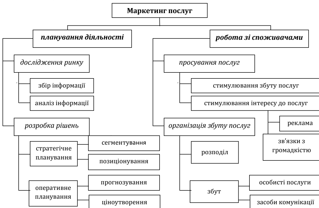
Рис. 1. Функціональна модель маркетингу послуг на підприємствах сфери послуг

Тобто, взаємодія двох вищезазначених блоків поєднується у функціональній моделі маркетингу послуг, в основі якої лежить раціональний розподіл та інтеграція праці фахівців маркетингових служб, що вимагає здійснення структуризації маркетингу (рис. 1).