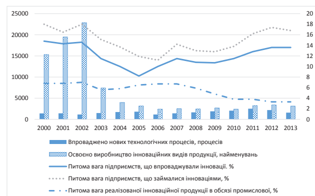
Рис. 2. Впровадження інновацій на промислових підприємствах України упродовж 2000-2013 рр.

Результатом інноваційної діяльності є впровадження інновацій та їх комерціалізація. Спостерігається нестійка тенденція зміни впроваджень нових технологічних процесів та освоєних інноваційних видів продукції. Так, упродовж 2003-2006 рр. спостерігається спад активності, а з 2007 р. незначне збільшення впроваджених нових технологічних процесів. У діапазоні 2,4-7,4 тис. найменувань коливається виробництво інноваційної продукції. При цьому при збільшенні питомої ваги підприємств, що впроваджували інновації, частка реалізованої інноваційної продукції зменшується і становить 3,3% у 2012 й 2013 рр. (рис. 2).