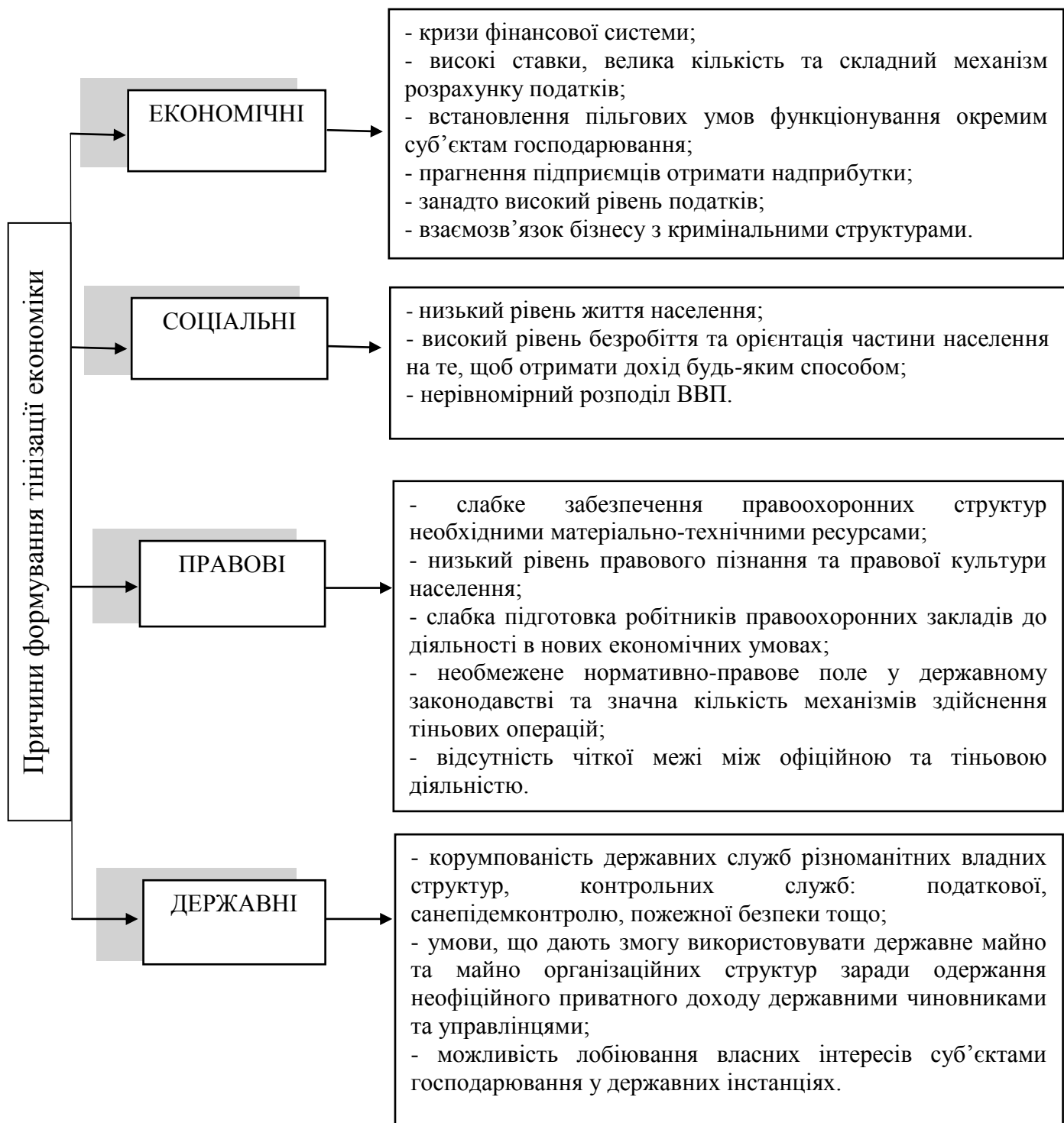
Рис. 2. Класифікація причин формування тінізації економіки

*Розроблено авторами на основі джерела: [14, 164].