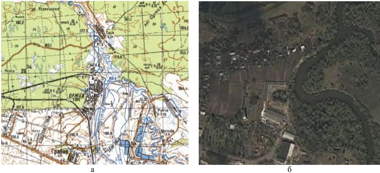
Рис. 2. Територіальна локалізація ключової ділянки «Оржів»: а – фрагмент ключової ділянки на топографічній карті (М 1:100000); б – фрагмент ключової ділянки з космосу (справа меандроване русло р. Горинь)

Одним із опорних розрізів перигляціальної лесово-грунтової серії Волинської височини, що за 12 км на південний схід від смт Оржева, є Рівненський, який розміщений у кар'єрі цегельного заводу м. Рівного. Тут добре розвинуті всі горизонти та підгоризонти верхнього та частково середнього плейстоцену [3]. Цей опорний розріз репрезентує лесовий покрив (понад 13 м потужність лесово-грунтової серії верхнього плейстоцену) Рівненської хвилясто-горбистої височини, до якої і приурочена південна частина ключової ділянки «Оржів».