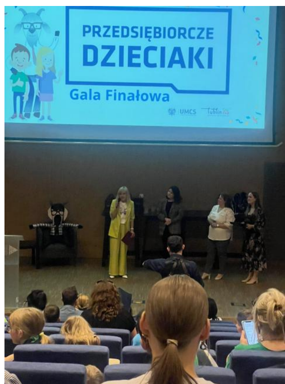
Гала-вечір проєкту «Підприємливі діти», Люблін, 2024 р.