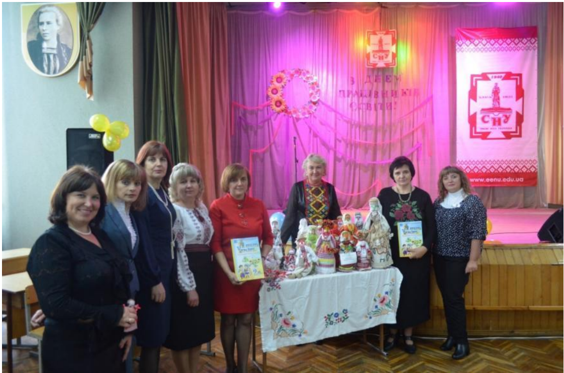
III Всеукраїнський науково-методичний семінар «Модернізація мовно-літературної освіти у початковій школі: надбання, пошуки та перспективи», Луцьк, 2016 р.