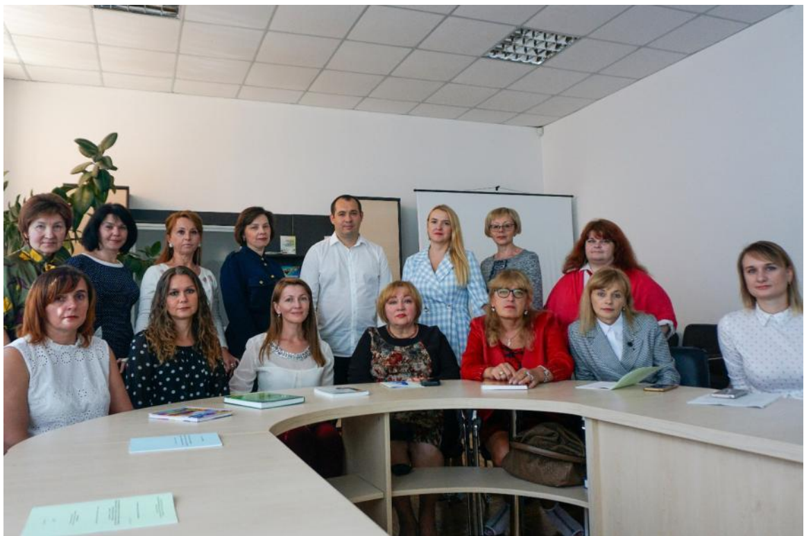
Засідання кафедри теорії і методики початкової освіти, 2022 р.