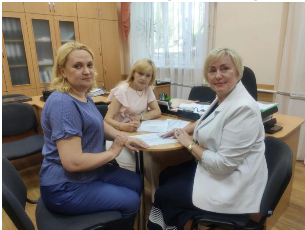
Рівненський державний гуманітарний університет Підписання документів про реалізацію права на академічну мобільність учасників освітнього процесу ВНУ імені Лесі Українки та РДГУ, 2023 р.