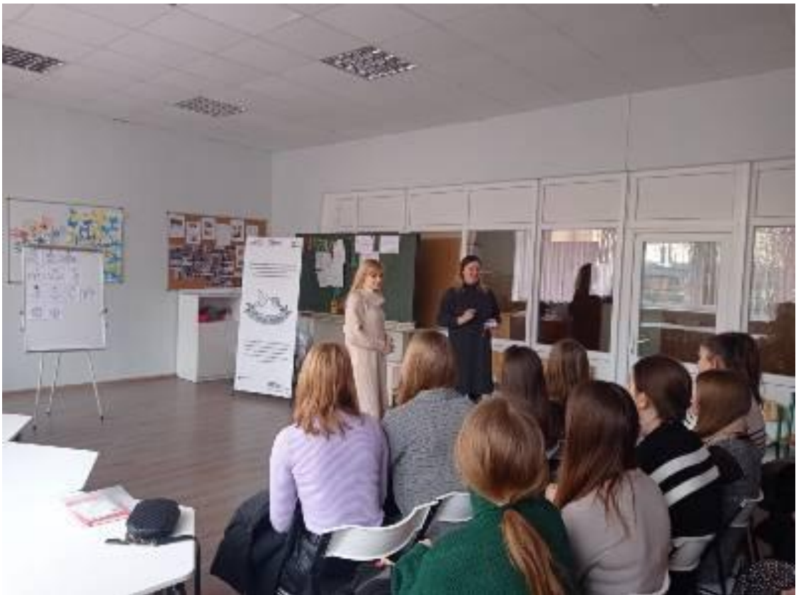
Співпраця із КЗЗСО «Луцький ліцей № 4 імені Модеста Левицького Луцької міської ради», 2023 р.