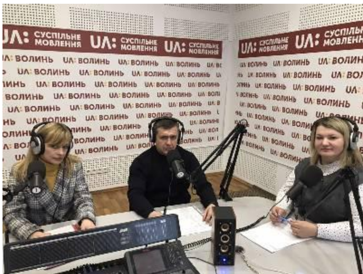
Радіодень. У Луцьку реалізують проєкт «Підприємливі діти», 2022 р.