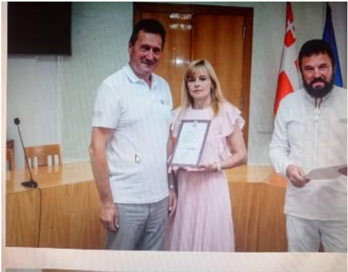
Стажування BUREAU VERITAS Quality Management Systems Internal Auditor Training Course (based on ISO 9001:2015 and ISO 19011:2018 Standards), 2022 р.