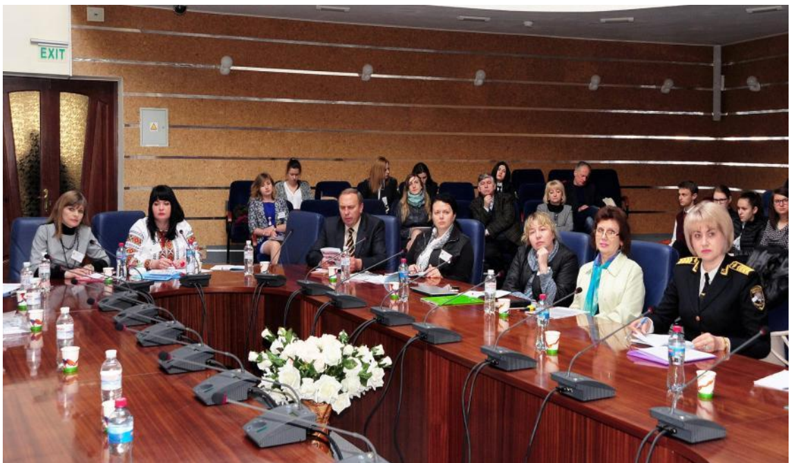
X Міжнародний науково-практичний семінар «Тенденції та перспективи формування професійної лексики», Ірпінь, 2020 р.