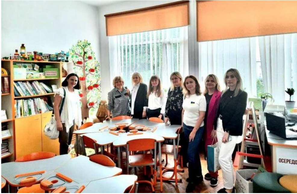
Співпраця між навчально-науковою лабораторією початкової освіти Нової української школи ВНУ імені Лесі Українки та навчально-науковою лабораторією Нової української школи Львівського національного університету імені Івана Франка, 2023 р.