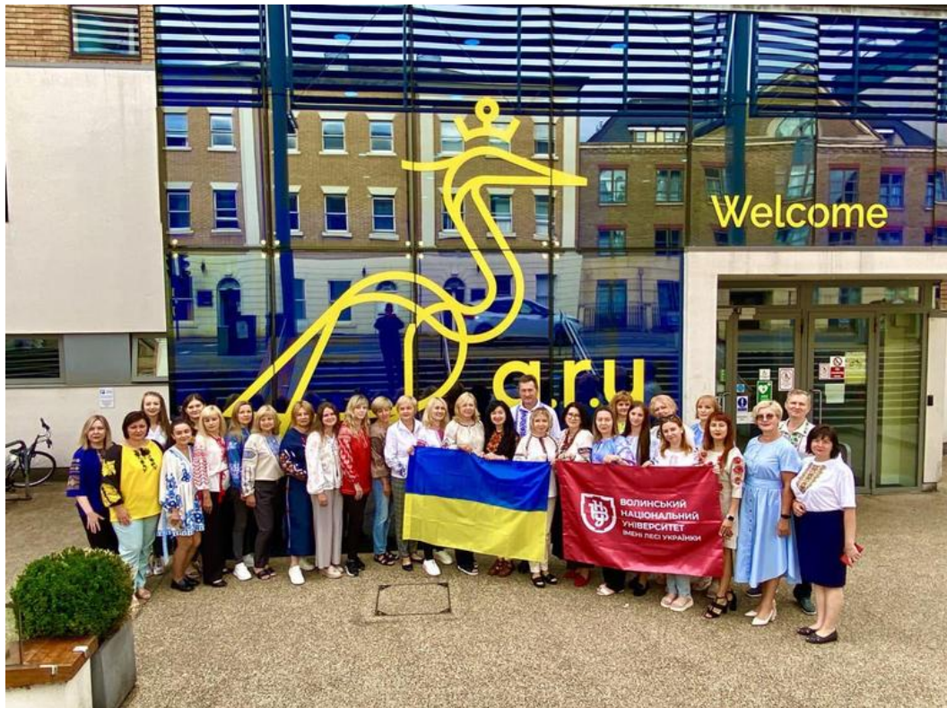
Стажування в межах Міжнародного проєкту UUKi grant UK-Ukraine R&I Twinning Scheme «Improving the Quality of Doctoral Supervisory Training: Capacity Building Workshops», England, Cambridge, Anglia Ruskin University, 2023 р.