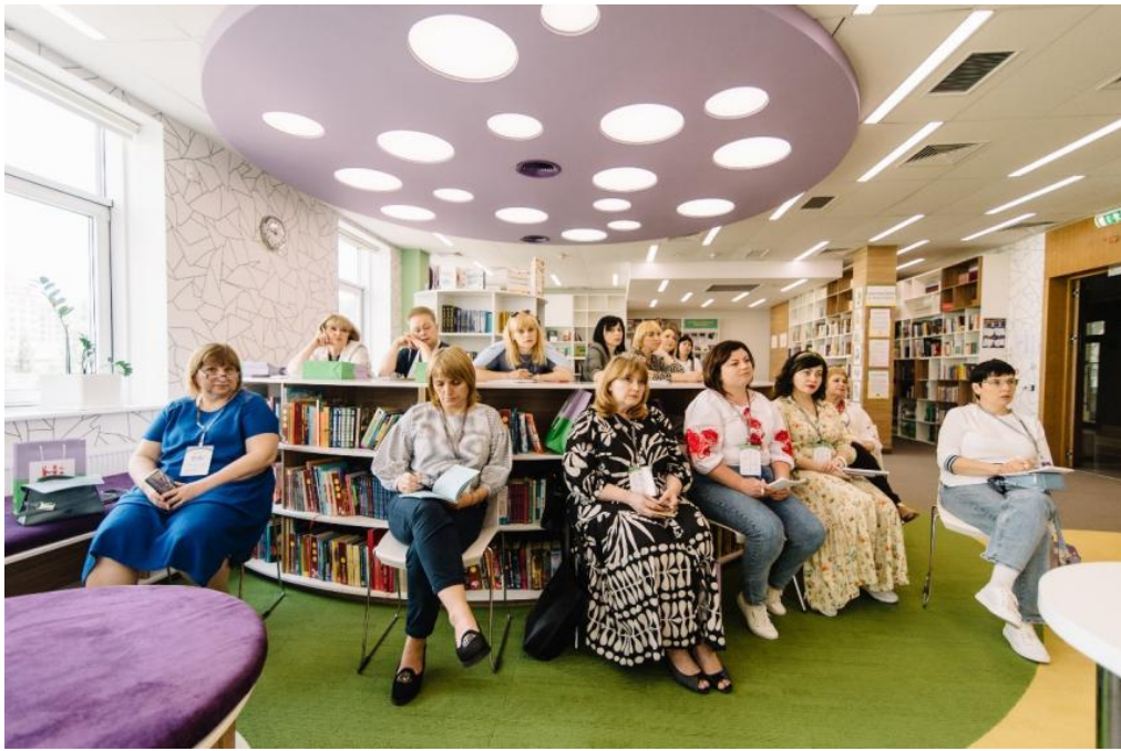
Співпраця із Навчально-виховним комплексом «Новопечерська школа», Київ, 2023 р.