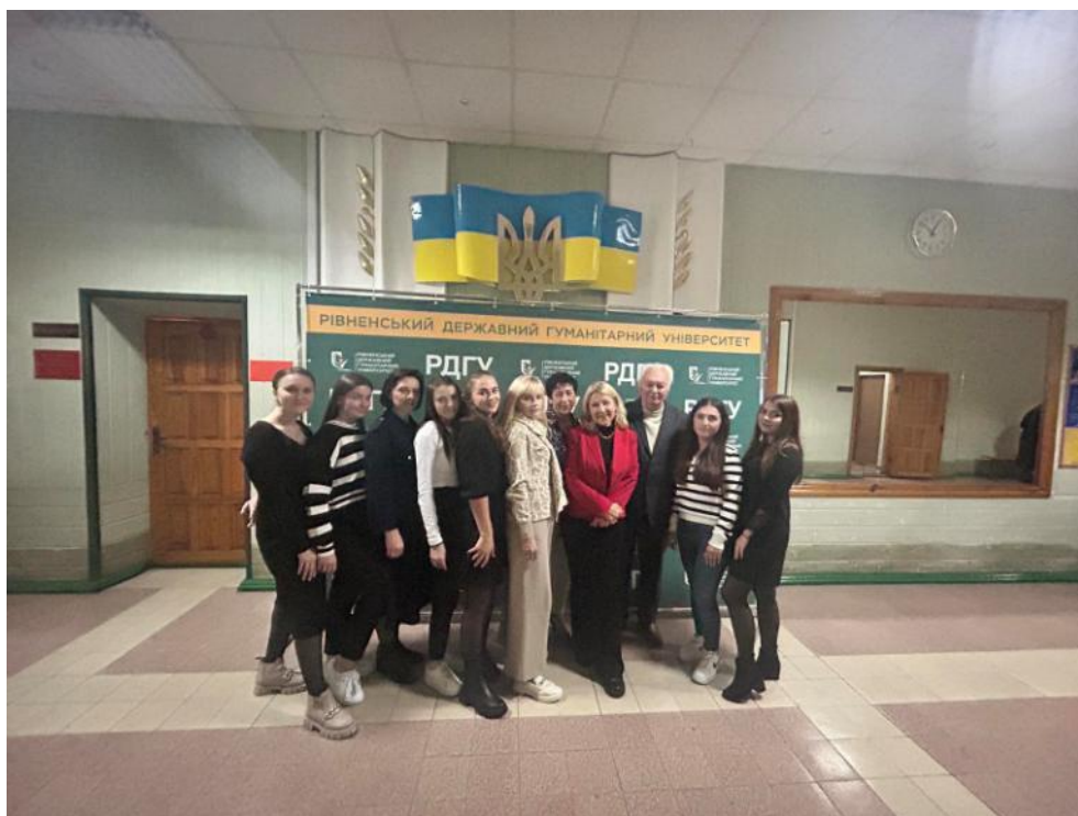
Рівненський державний гуманітарний університет Всеукраїнський вебінар-практикум «Сучасний урок у початковій школі: мотивуємо, плануємо, проводимо», 2023 р.