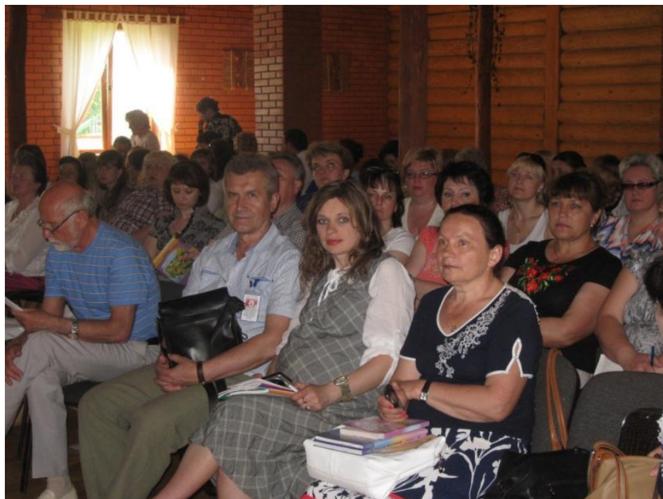
I Всеукраїнський науково-методичний семінар «Модернізація мовно-літературної освіти у початковій школі: надбання, пошуки та перспективи», Луцьк, 2014 р.