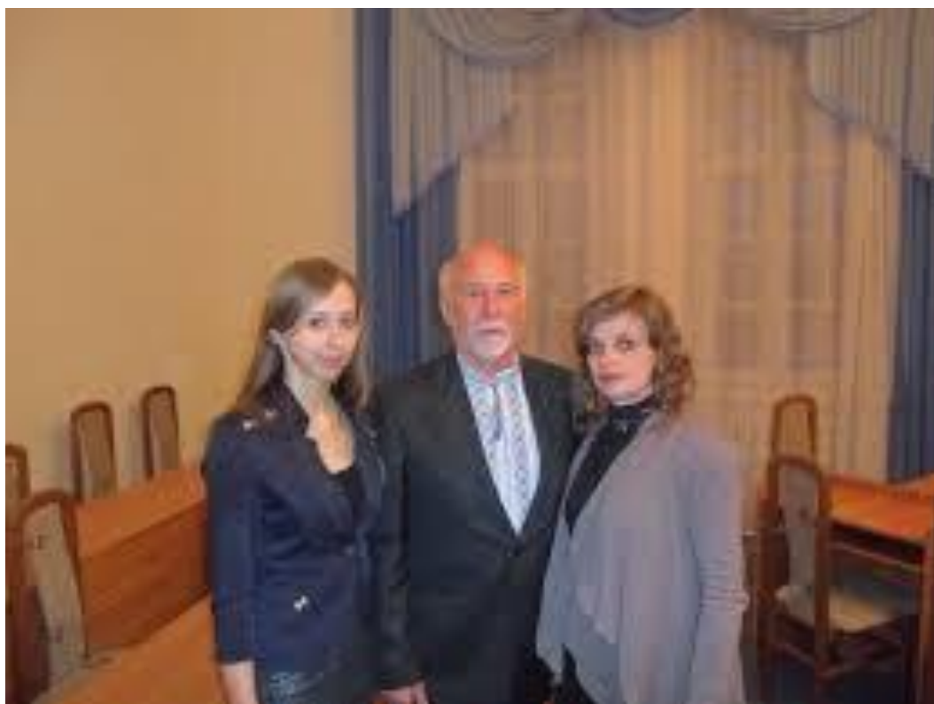
Глухів, 2014 р.