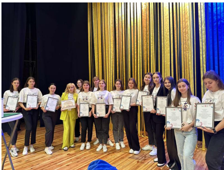
Гала-вечір проєкту «Підприємливі діти», Луцьк, 2024 р.