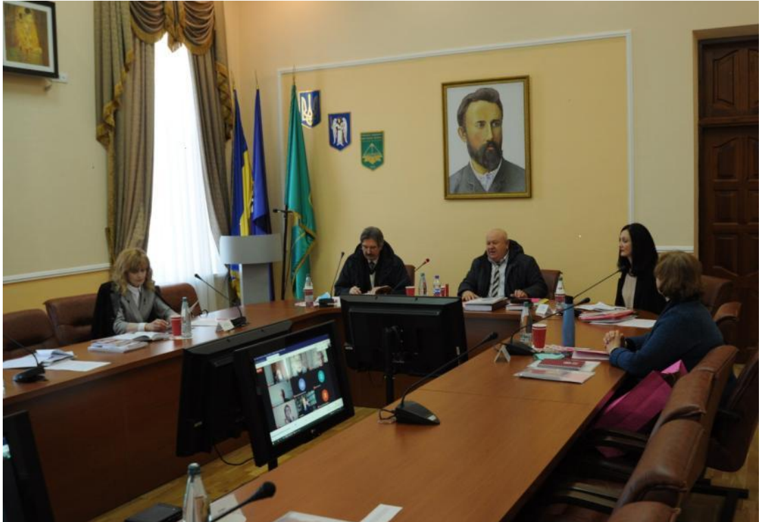
Захист докторської дисертації, 2021 р.