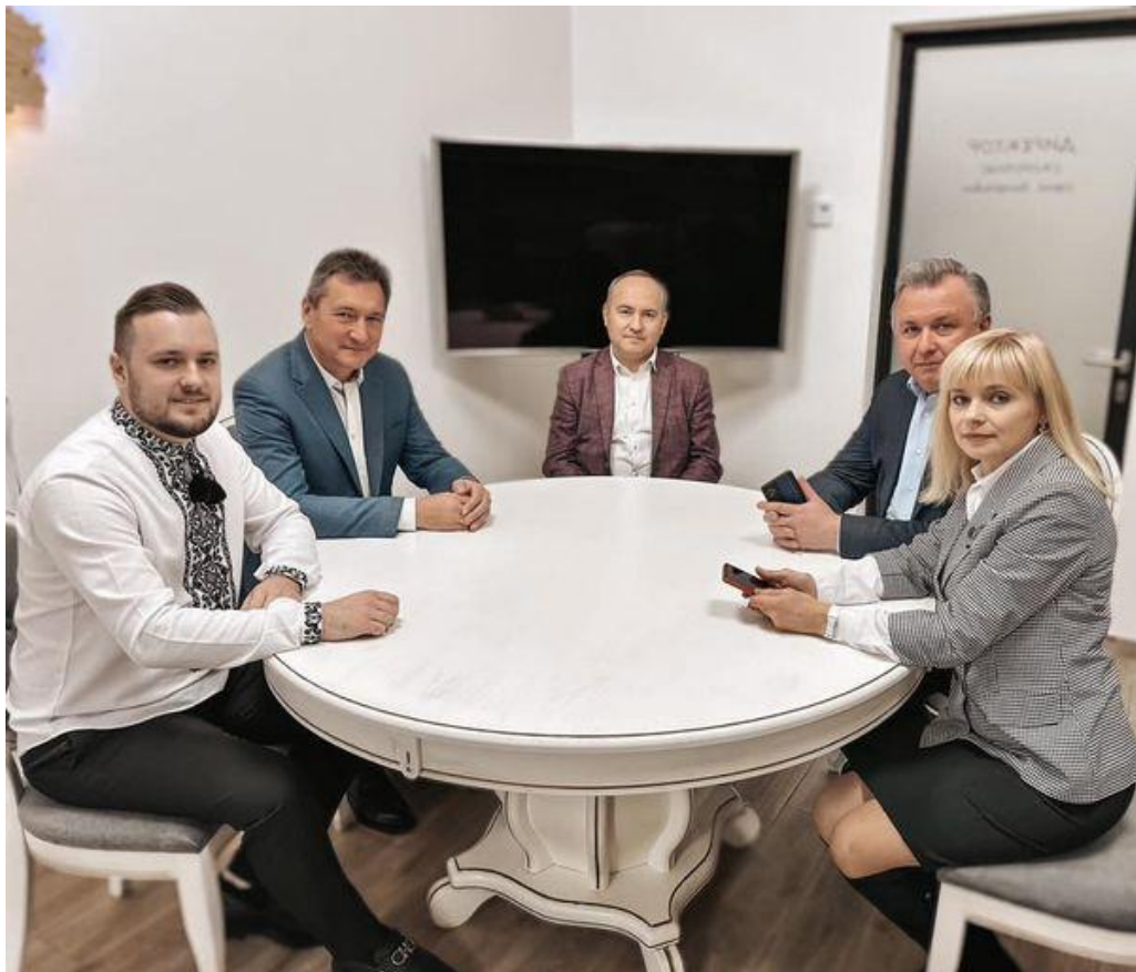
Співпраця із Приватним закладом «Дубенська гімназія «Премудрість» Дубенської міської ради Рівненської області», 2023 р.