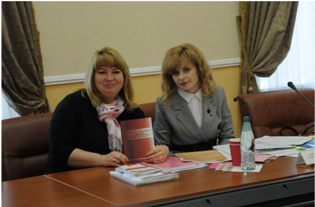
Захист докторської дисертації, 2021 р.