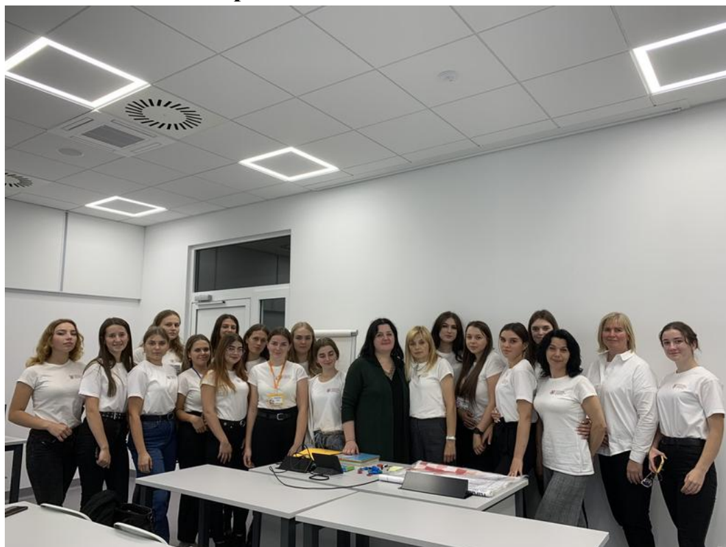
Стажування, Люблін (Польща), 2022 р.