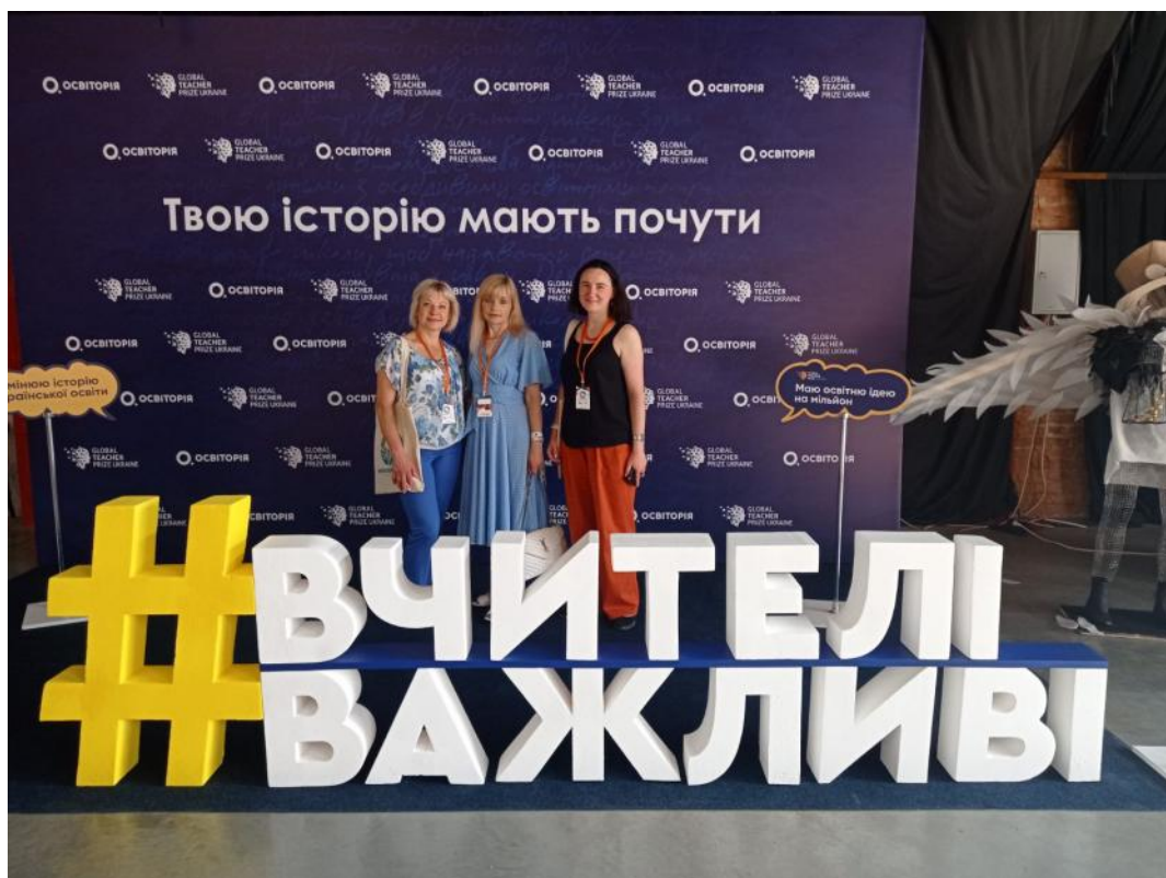
Освітній фестиваль «Вчителі майбутнього», Львів, 2023 р.