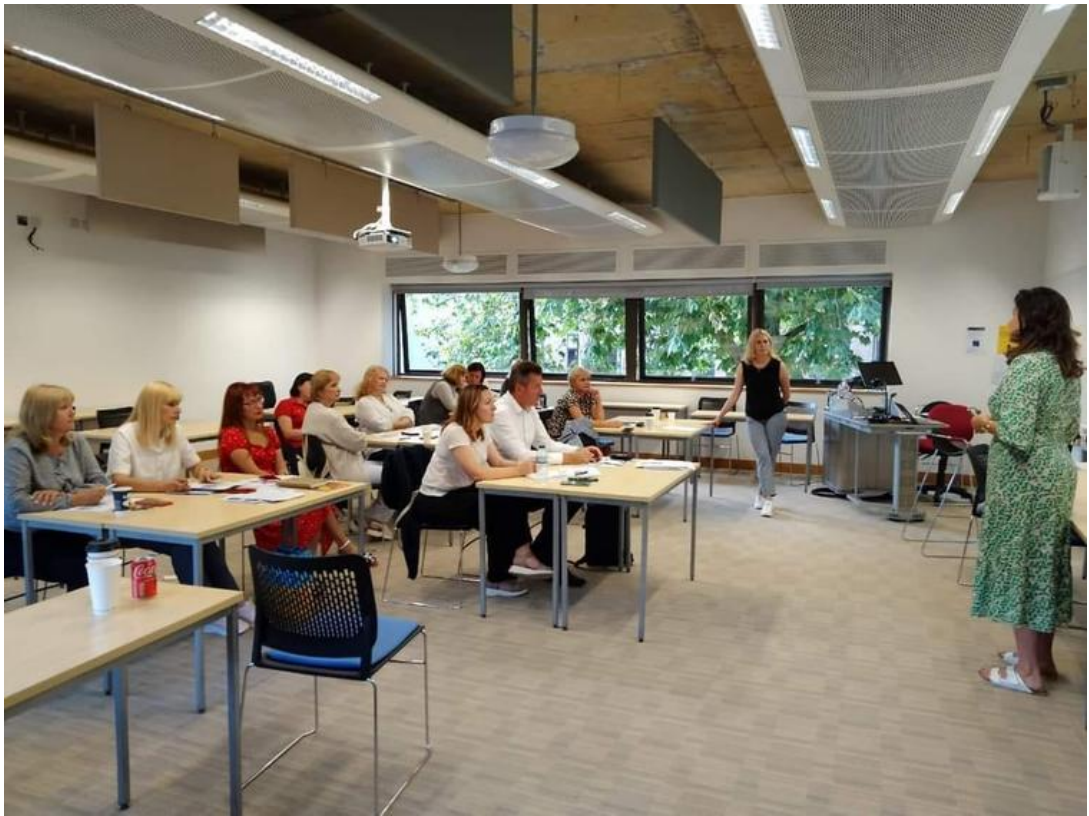
Стажування England, Cambridge, Anglia Ruskin University, 2023 р.