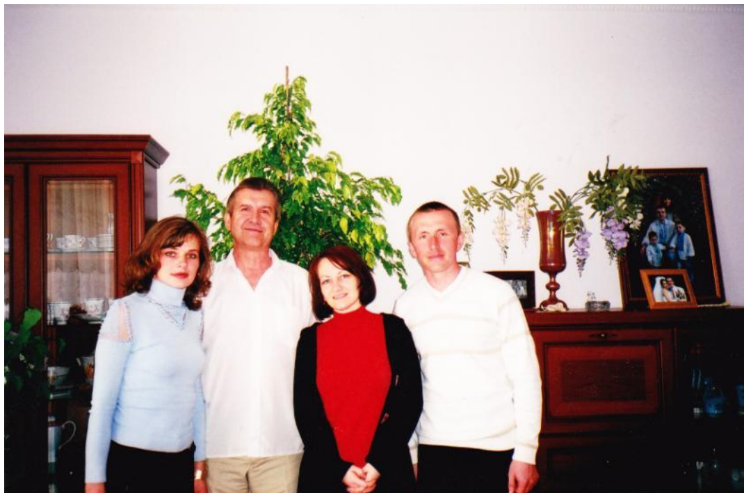
Наукова школа проф. І. М. Хом'яка