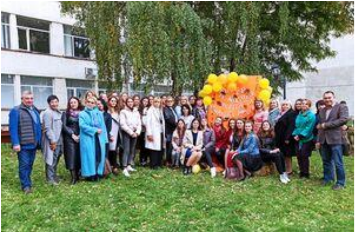
Всеукраїнський науково-методичний семінар «Нова українська школа: теорія та практика», Луцьк, 2021 р.