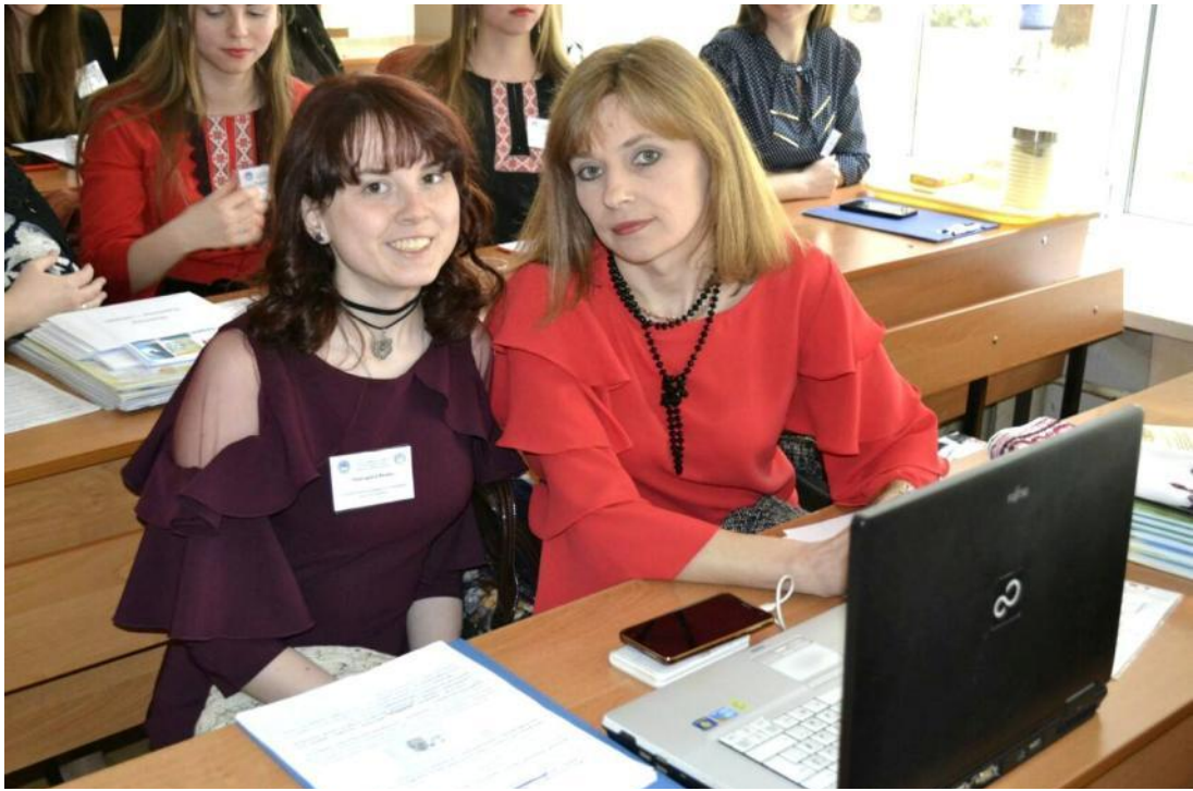
Вінниця, 2017 р.