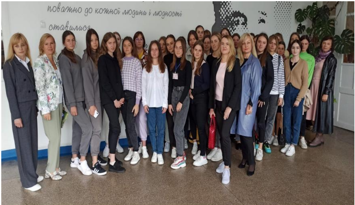
Співпраця із КЗЗСО «Луцький ліцей № 4 імені Модеста Левицького Луцької міської ради», 2022 р.