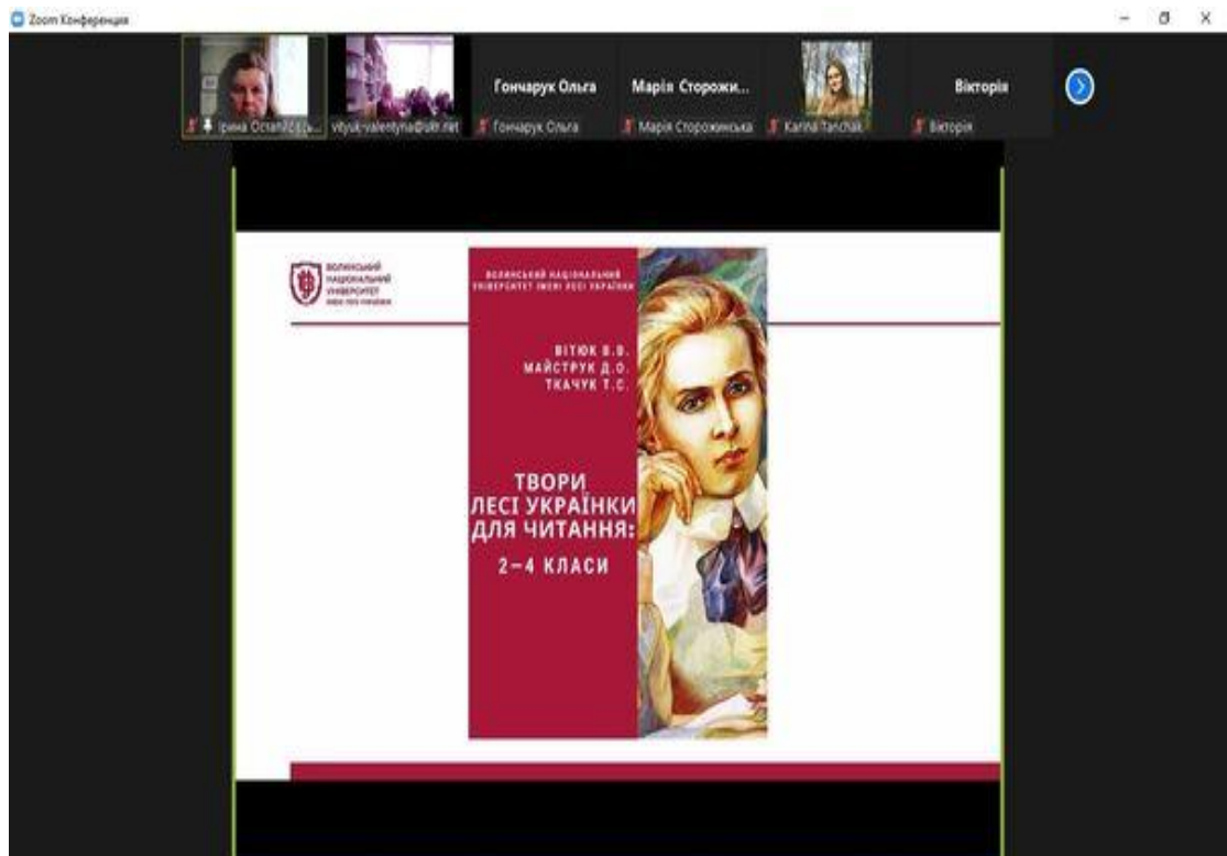
Вінниця, 2022 р.