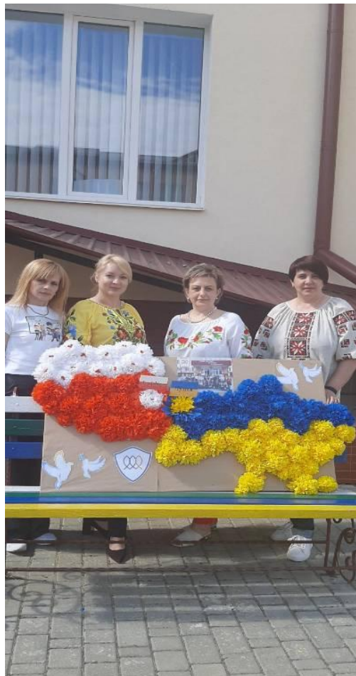
Співпраця із КЗЗСО «Луцький ліцей № 27 Луцької міської ради», 2022 р.