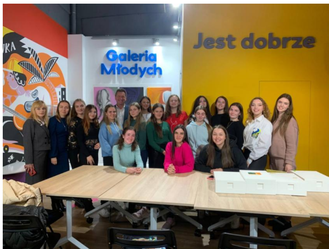
Стажування, Люблін (Польща), 2022 р.