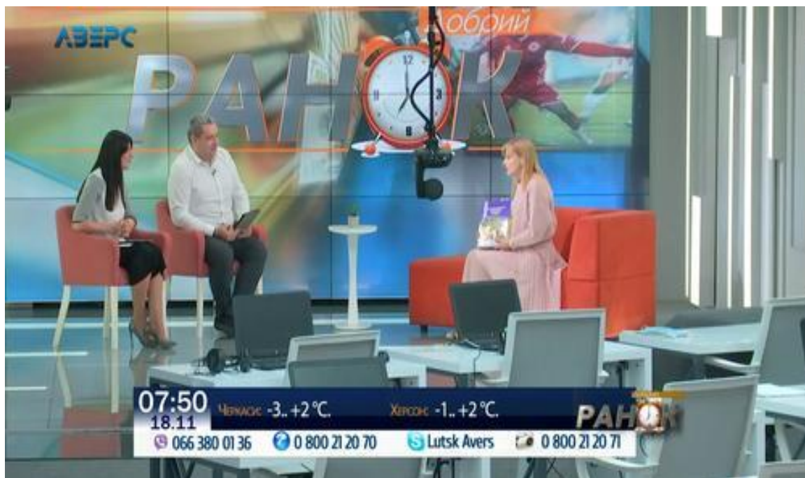
Добрий ранок : Розвиток інтересу до читання у молодших школярів, 2020 р.