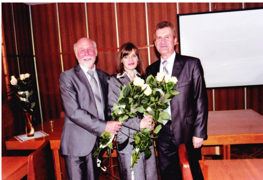
Захист кандидатської дисертації, 2011 р.