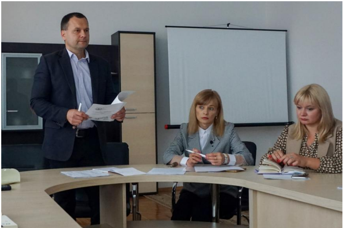
Засідання деканату, 2022 р.