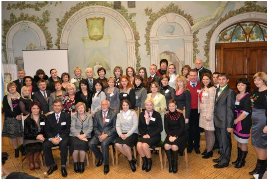
Всеукраїнська науково-практична конференція «Актуальні проблеми культури української мови і мовлення», Остріг, 2012 р.