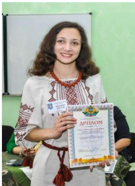
Умань, 2016 р .