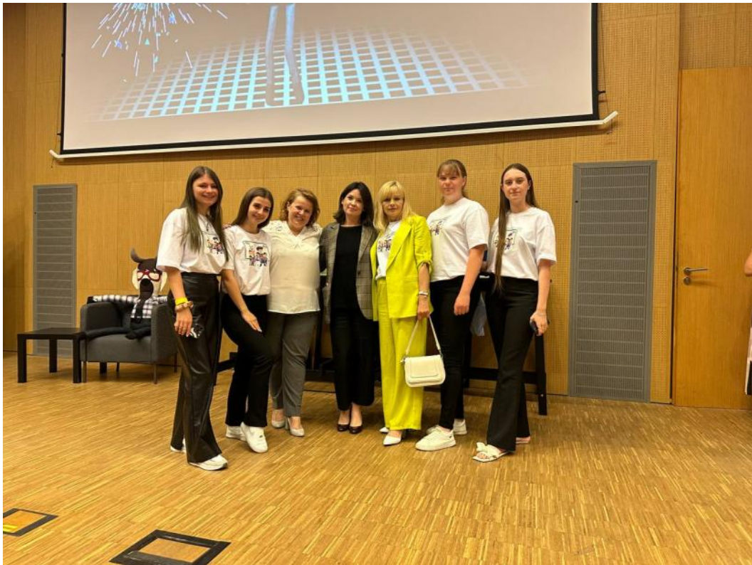
Гала-вечір проєкту «Підприємливі діти», Люблін (Польща), 2024 р.