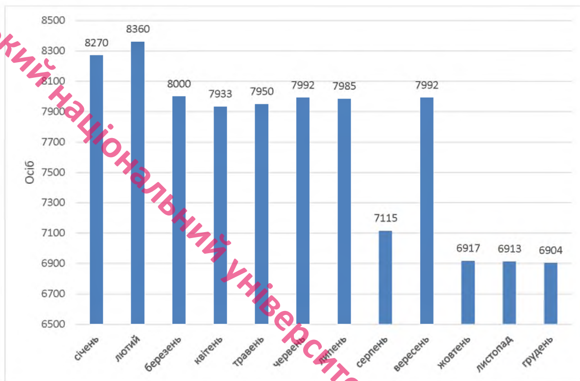
Рис. 2.1. – Динаміка призначення допомоги на проживання внутрішньо переміщеним особам протягом 2023 року, осіб[10].

Отже, аналізуючи рисунки 2.1-2.2 можна відмітити тенденцію до зменшення призначення допомоги на проживання внутрішньо переміщеним особам протягом трьох останніх місяців 2023 року, зокрема на 16,5 % якщо порівнювати січень із груднем. Така ситуація пояснюється значною активізацією верифікації даних отримувачів даної допомоги департаментом соціальної та ветеранської політики Луцької міської територіальної громади та збільшенням кількості перевірок головного управління Національної соціальної сервісної служби у Волинській