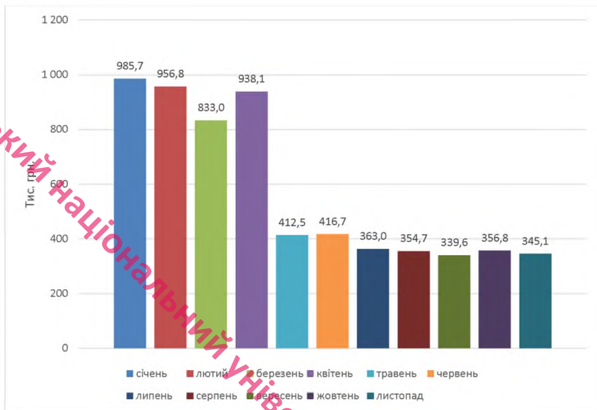
Рис. 2.4. – Динаміка компенсації витрат за тимчасове розміщення (перебування) внутрішньо переміщених осіб протягом 2023 року, тис. грн.[10].

територіальну громаду як тимчасовий перевалочний пункт для переїду у країни Європейського союзу.