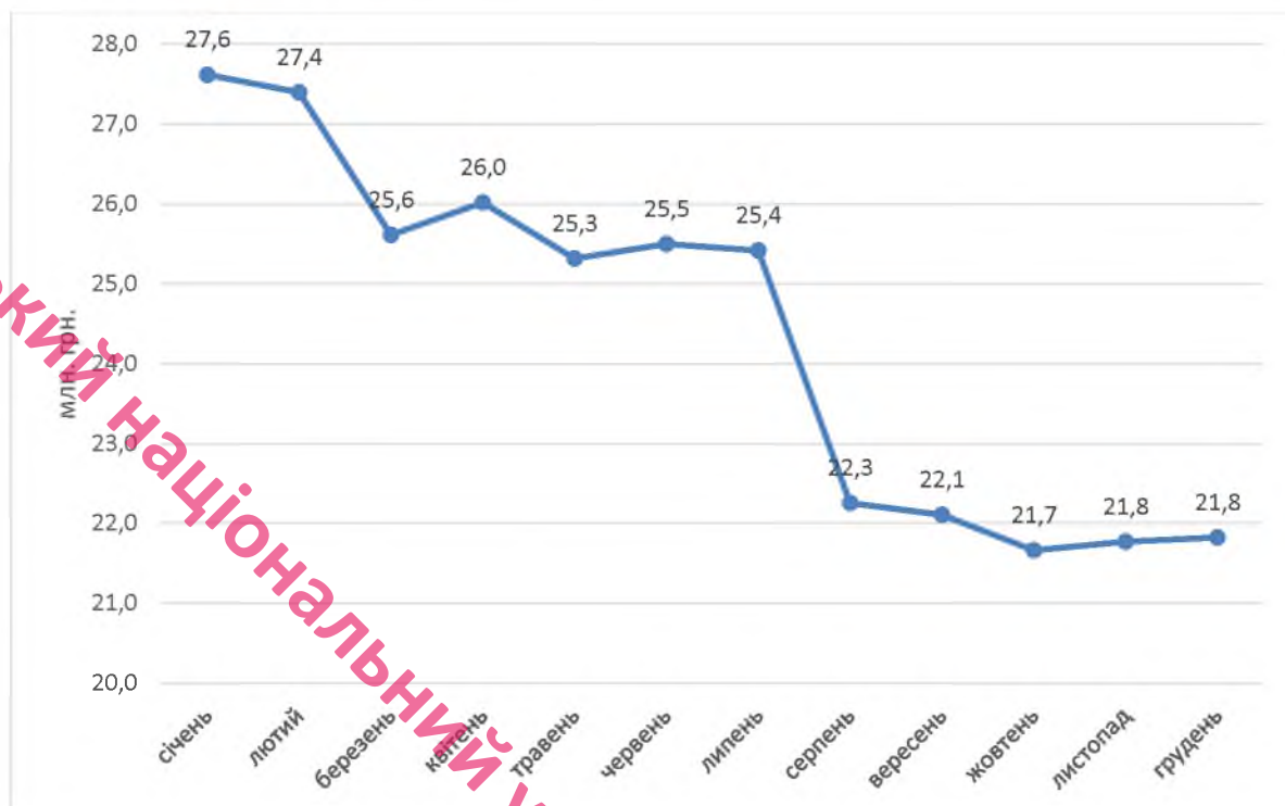
Рис. 2.2. – Динаміка призначення допомоги на проживання внутрішньо переміщеним особам протягом 2023 року, млн. грн.[10].

області, щодо підтвердження права на отримання даної допомоги та пошуку подвійної виплати у різних регіонах.