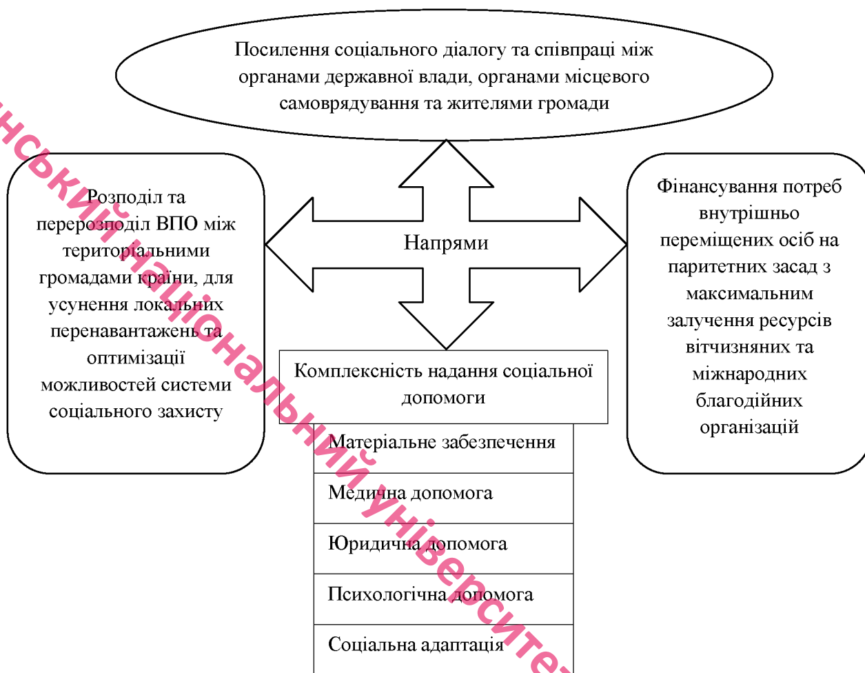
Рис. 2.5. Напрями вдосконалення соціального захисту внутрішньо переміщених осіб

соціальному та правовому середовищі, роблячи їх менш вразливими перед юридичними труднощами, які можуть виникнути при міграції.