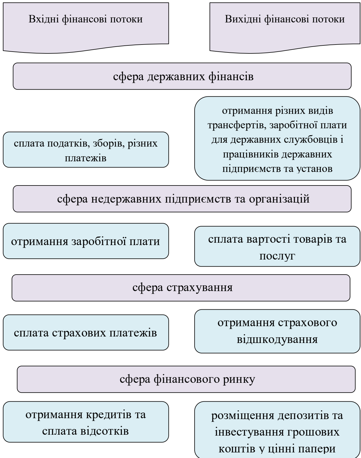
Рис. 2. Взаємозв'язок фінансових потоків домогосподарств з іншими сферами економіки