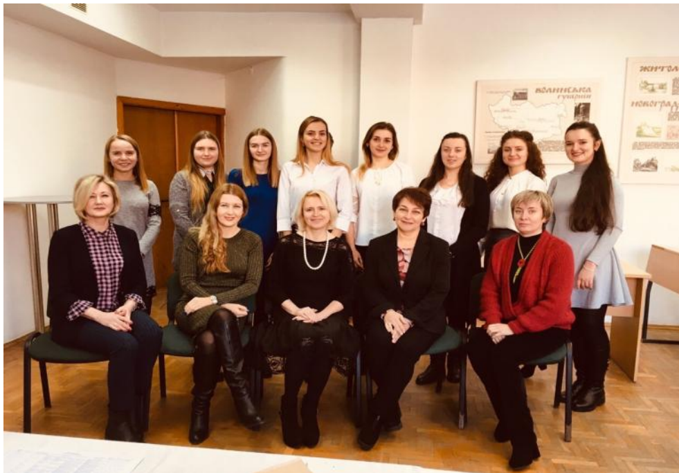
З викладачами-членами ДЕК і студентами факультету філології та журналістики після успішного захисту магістерських робіт, січень 2019 р.