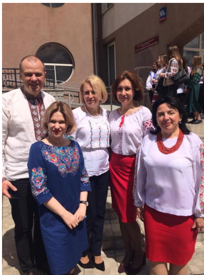
З колегами із факультету філології та журналістики в День вишиванки, травень 2021 р.