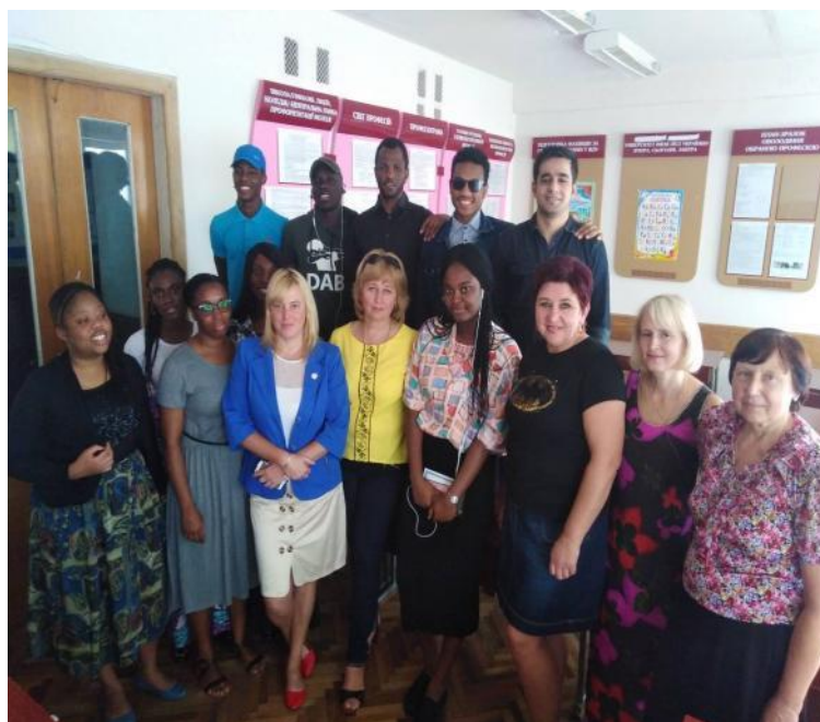
З викладачами і студентами-іноземцями підготовчого відділення ВНУ імені Лесі Українки, 2018 р.