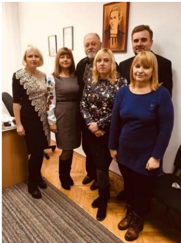
Викладачі-граматисти кафедри української мови, листопад 2018 р.