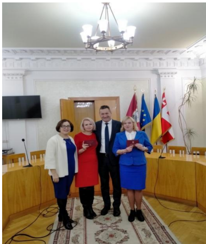
Вручення атестата професора на вчній раді ВНУ імені Лесі Українки, листопад 2021 р.