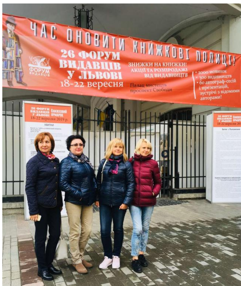
З колегами на 26 Форумі видавців, Львів, вересень 2019 р.