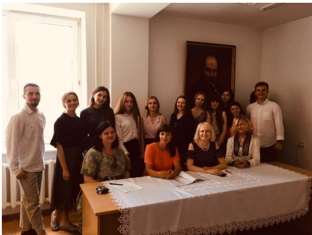
З викладачами і студентами факультету філології та журналістики ВНУ імені Лесі Українки після державного іспиту, червень 2019 р.