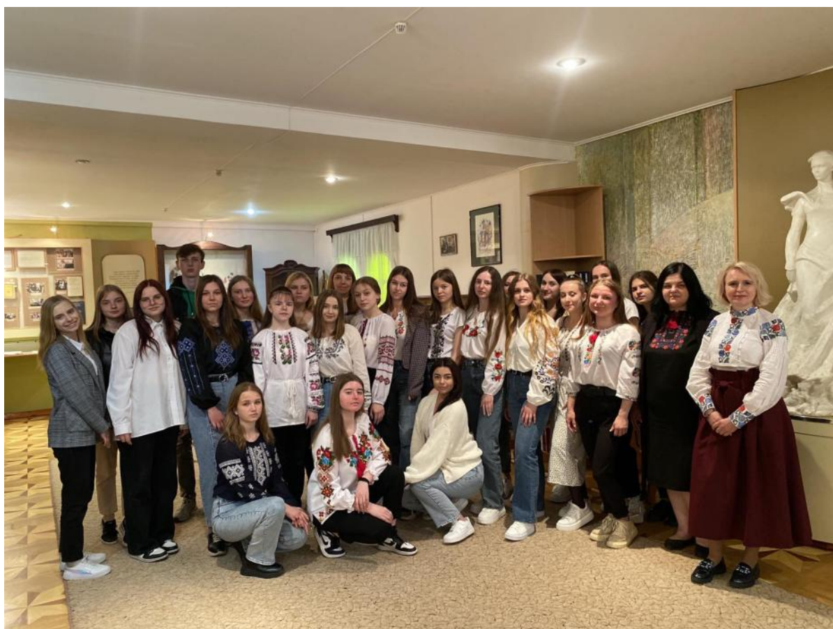
З колегами і студентами-першокурсниками факультету філології та журналістики в музеї Лесі Українки, травень 2023 р.