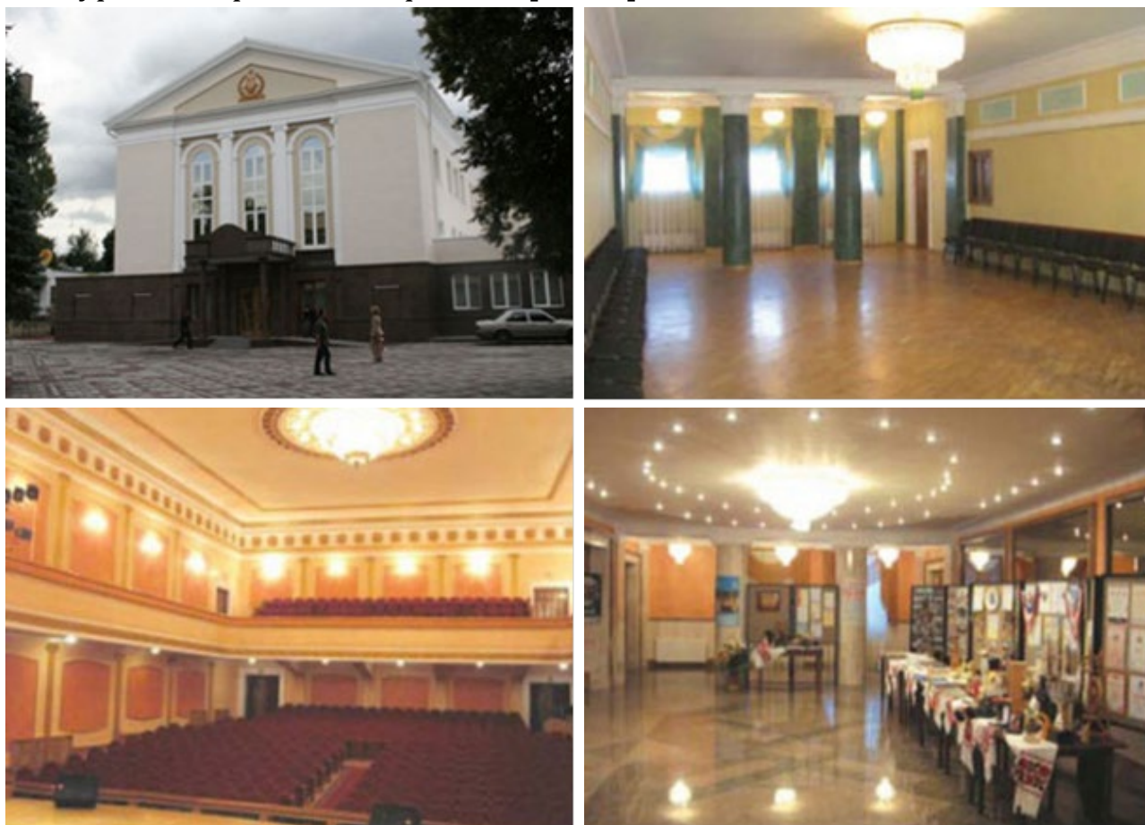
Рис. 1. Палац культури міста Луцька: а) центральний фасад; б) фойє; в) концертна зала; г) виставкова зала

Гордістю Палацу культури міста Луцька та Волинського краю загалом є самобутні мистецькі колективи: зразковий ансамбль народного танцю “Волиняночка”, народний духовий оркестр, народний ансамбль народного танцю “Волинянка”, народний оркестр народних інструментів “Волинянка”, народний ансамбль народної музики “Волиняночка”, народний ансамбль бального танцю “Юність”, народний фольклорний гурт “Чачка”, народна хорова капела “Посвіт”, народний чоловічий хор ветеранів війни та праці “Подвиг”, народний вокальний ансамбль “Джерела Волині”, зразкова театральна студія “Бешкетники”. Учасники колективів беруть активну участь у міських культурно-мистецьких заходах, численних міжнародних фестивалях та конкурсах в Україні і за кордоном [2; 6–7].