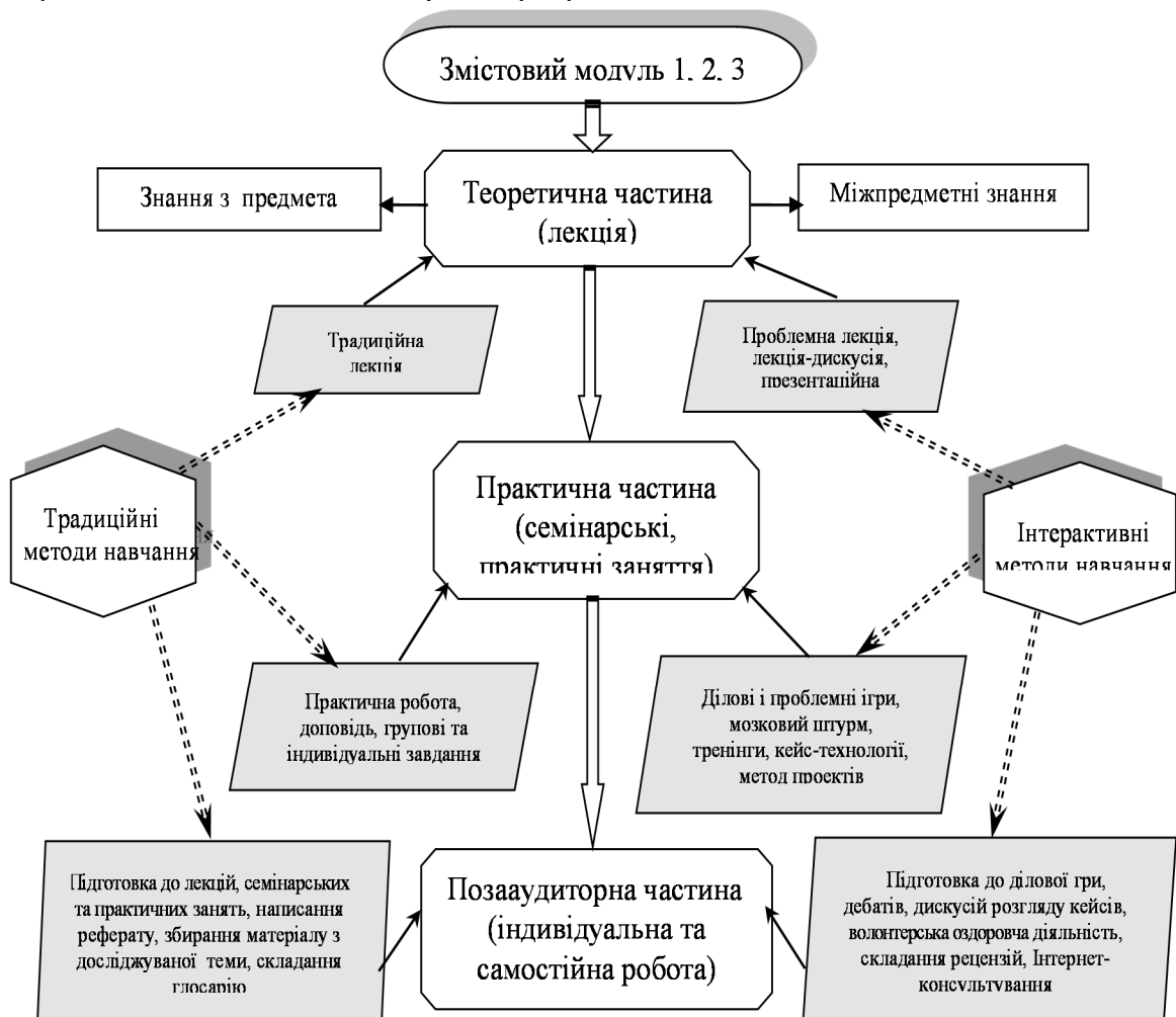
Рис. 2. Використання різних методів навчання в підготовці майбутніх учителів фізичної культури

У навчальному процесі підготовки майбутніх учителів фізичної культури ми використовуємо інтегроване поєднання загальнодидактичних методів і методів активного навчання, які передбачають суб'єкт-суб'єктну взаємодію учасників педагогічного процесу, їх самоактуалізацію та самоорієнтацію (рис. 2). У таких умовах студент є не пасивним об'єктом, на який спрямована педагогічна дія, а включеним у педагогічний процес активним суб'єктом, якому надається можливість підвищити рівень самостійності, а також визначитися з вибором змісту та методів навчання, спрямованих на підготовку до професійної діяльності.