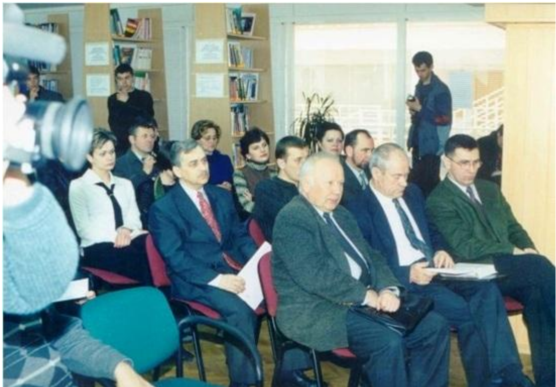
На презентації книг у бібліотеці ВНУ ім. Лесі Українки