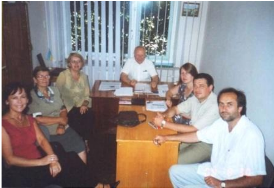
Засідання кафедри Давньої і нової історії України, 2004 р.