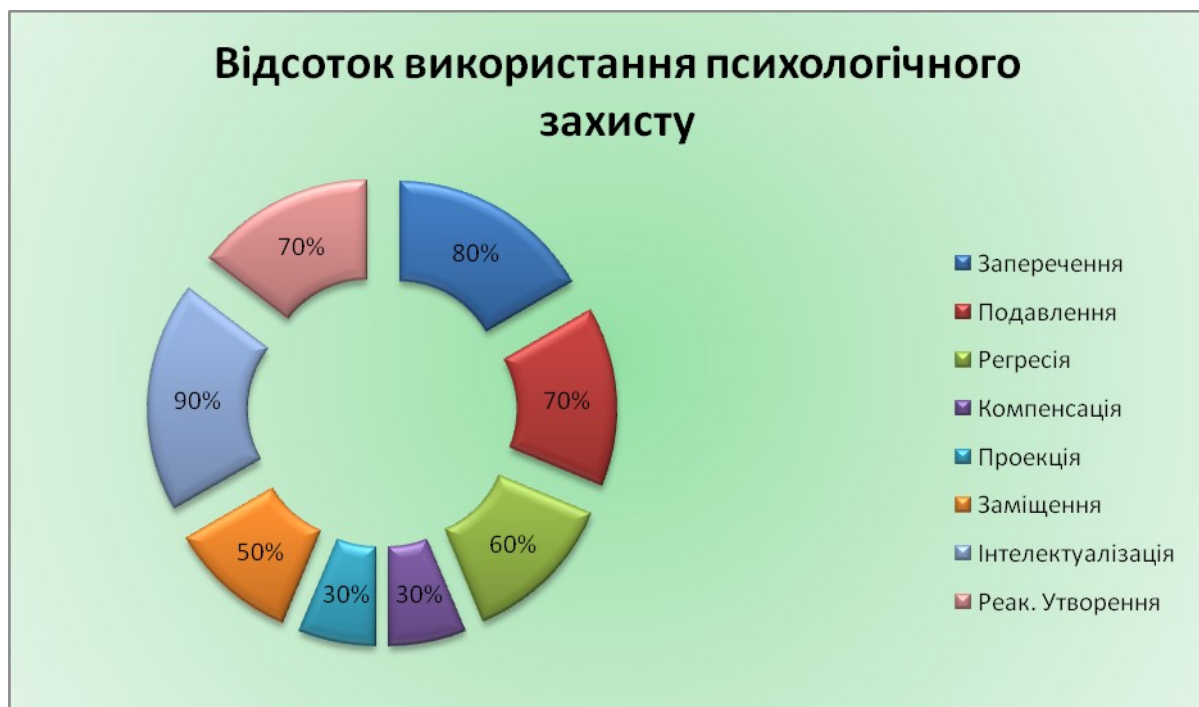
Рис. 1. Відсоткове співвідношення видів психологічного захисту серед підлітків, котрі перебувають у місцях позбавлення волі

Так, за допомогою методики «ІЖС» нами було виявлено, що 90% досліджуваних користуються психологічним захистом інтелектуалізації, 80% із загальної кількості використовують заперечення, а 70% – реактивні утворення та подавлення. Найменш актуальним є психологічний захист компенсації (30%) (рис. 1).