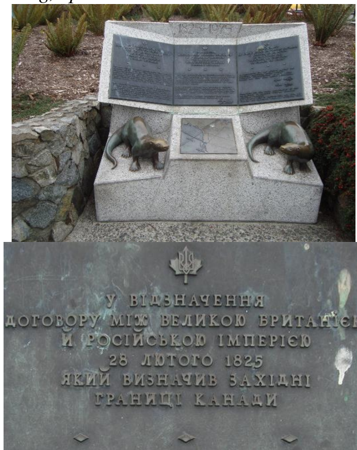
Рис. 1.1. Монумент у м. Вікторія з нагоди 150-річчя укладання договору [29]

Stratford Canning, британський дипломат.