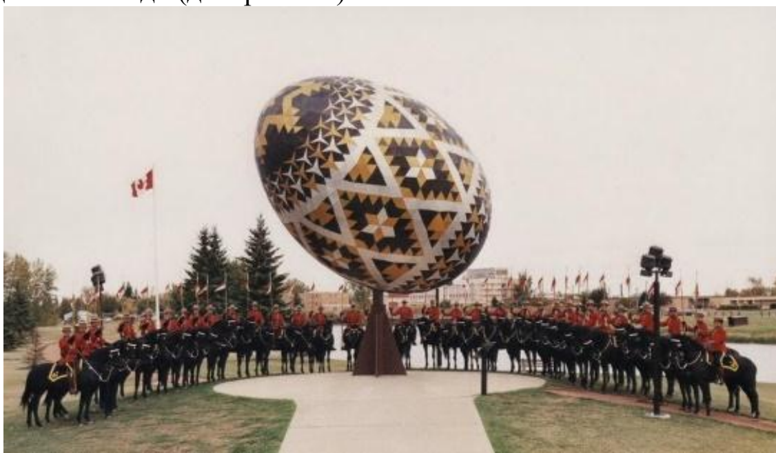
Рис. 1.3. Українська писанка. Вегревіль (Vegreville), Альберта [11]

Навіть наша писанка, улюблений вид традиційного українського фольклорного мистецтва, стала частиною багатой мультикультурної спадщини Канади (див. рис. 1.3).