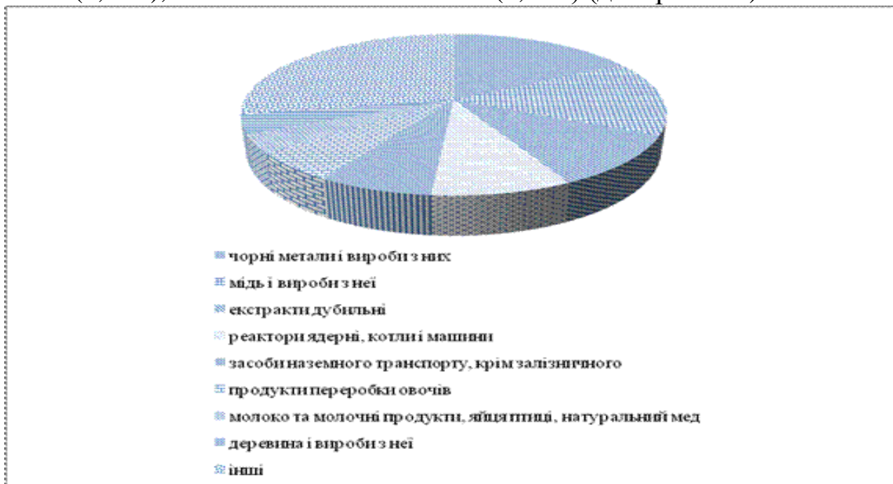
Рис. 2.1. Структура українського експорту товарів до Канади за 11 місяців (січень-листопад) 2017 р. (складено за [3])

У структурі українського експорту товарів до Канади переважали поставки чорних металів і виробів із них (16,9 %), міді та виробів із неї (15,0 %), екстрактів дубильних (10,5 %), реакторів ядерних, котлів і машин (9,0 %), засобів наземного транспорту, крім залізничного (7,4 %), продуктів переробки овочів (5,7 %), молока й молочних продуктів, яєць птиці, натурального меду (3,8 %), деревини та виробів із неї (3,8 %), залізничних локомотивів (3,3 %) (див. рис. 2.1).