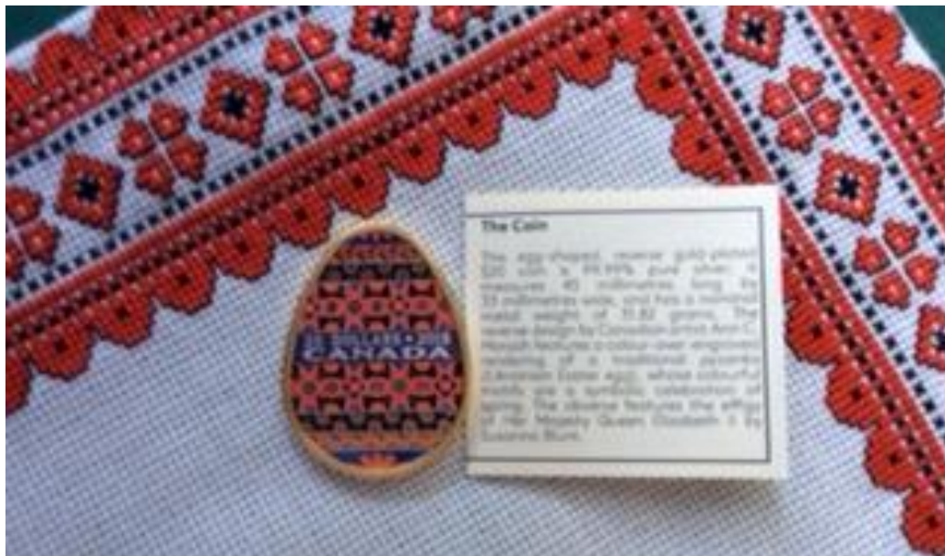
Рис. 1.4. Срібна позолочена монета у вигляді писанки 2018 р. (тираж – 5 тис.) [27]

Із нагоди 125-ліття поселення українців у Канаді (2016) монетний двір Канади ( Royal Canadian Mint ) [27], який розміщено у Вінніпезі, випустив першу у світі срібну монету у вигляді писанки (вартістю 20 дол. Канади) (див. рис. 1.4). Монети у вигляді писанки користуються великим попитом.