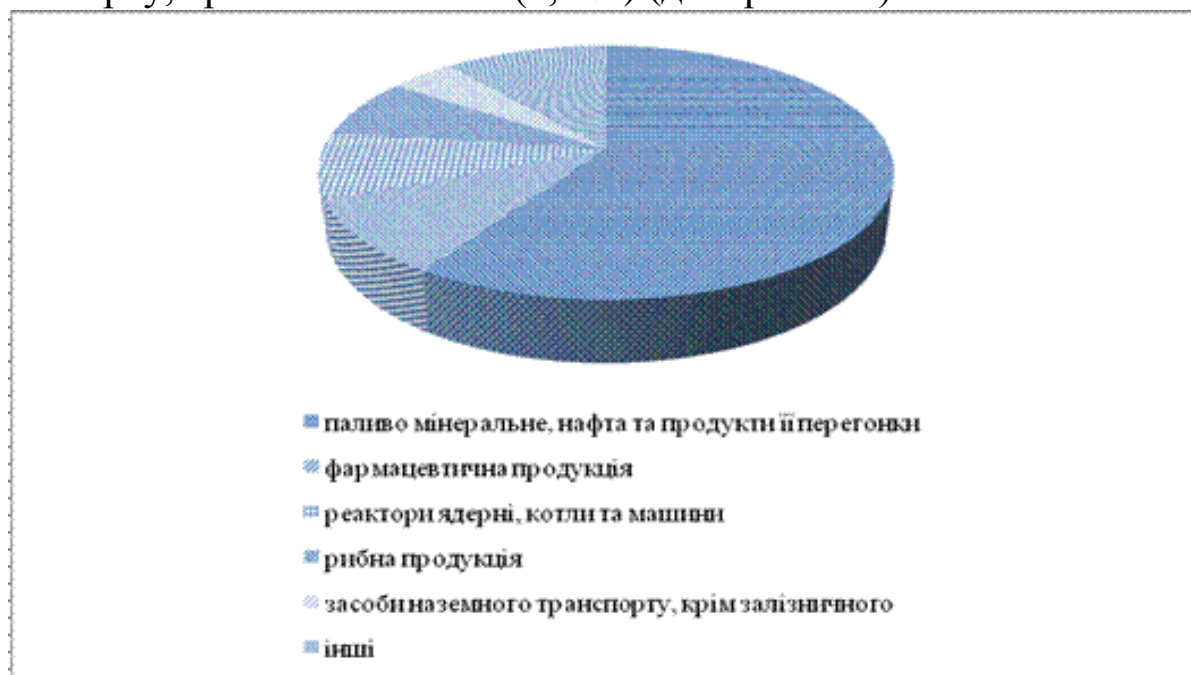
Рис. 2.2. Структура українського імпорту товарів із Канади за 11 місяців (січень-листопад) 2017 р. (складено за [3])

котлів і машин (8,4 %), рибної продукції (7,5 %), засобів наземного транспорту, крім залізничного (4,4 %) (див. рис. 2.2).