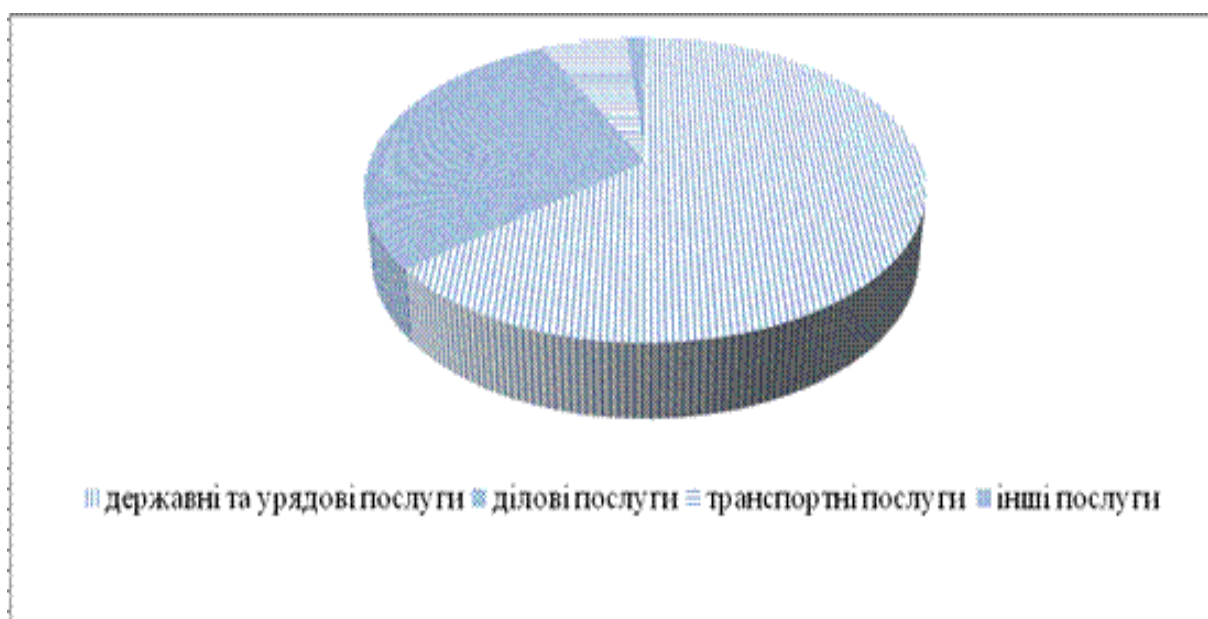
Рис. 2.4. Структура українського імпорту послуг із Канади за 11 місяців (січень-листопад) 2017 р. (складено за [3])

Хоча обсяг канадських інвестицій складає лише 0,1 % від загального обсягу інвестицій в економіку України, після ратифікації Угоди про зону вільної торгівлі з Канадою спостерігаємо певну зацікавленість канадських інвесторів.