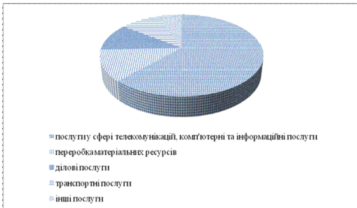
Рис. 2.3. Структура українського експорту послуг до Канади за 11 місяців (січень-листопад) 2017 р. (складено за [3])