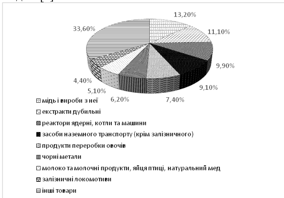
Рис. 2.6. Структура експорту товарів з України до Канади (за 9 міс. 2017 р.) (складено за [9])

Найбільше у 2017 р., порівняно з попереднім періодом, зросли обсяги поставок з України до Канади комп'ютерного обладнання, керамічної плитки, скляної й пластикової тари, спортивного спорядження, соняшникової олії, меду. За п'ять місяців 2017 р. відбулося зростання експорту продуктів переробки овочів (консерви та соки) з 83 тис. дол. до 2,5 млн дол. [7].