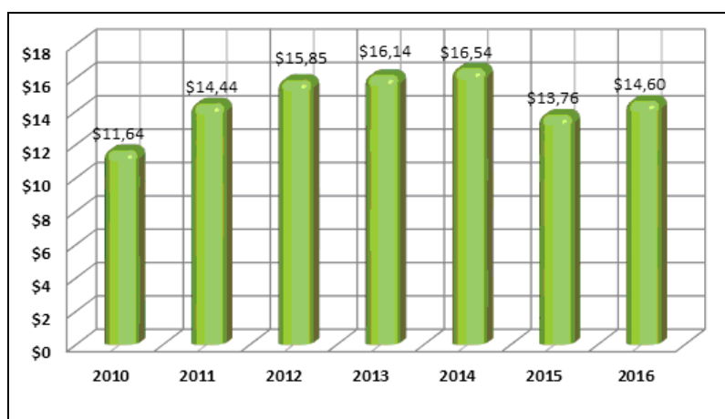
Рис. 1. Динаміка ВВП Грузії 2010- 2016 рр., млрд дол. США [14]

Залученню іноземних туристів сприяє й сучасна візова політика Грузії. Так, на сьогодні грузинський парламент скасував візи громадянам 94 країн світу, включаючи Україну. Крім того, громадяни 50 країн планети, включаючи США, ОАЕ, країн-членів ЄС та Ізраїль, мають право на постійне проживання в Грузії [14]. Тому доходи від туризму в сукупному ВВП Грузії постійно зростають. Так, сукупний ВВП країни на 2016 р. становив 14,6 млрд дол. США, який зріс порівняно з 2015 р. (13,7 млрд дол. США), проте є значно меншим від 2014 р., коли він становив 16,54 млрд дол. США, що пов'язано з інфляційними процесами в країні (рис. 1). За офіційними даними, частка прибутків від туризму в сукупному ВВП у 2016 р. становила 7,3 %, тоді як у 2015 р. цей показник складав тільки 6,6 % [12]. Причому частка доходів від іноземного туризму постійно зростає. Тому уряд Грузії робить все можливе, щоб цей показник у 2020 р. досяг уже 12 %.