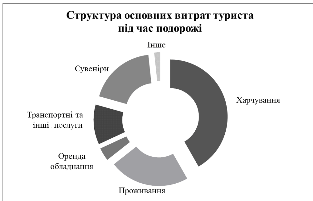
Рис. 1. Структура основних витрат туриста під час подорожі [5]

Щодо кількості подорожей на рік, то 39 % опитаних подорожує принаймні один раз на рік, 26 % відпочивають двічі, 20 % – 3–5 разів на рік, 13 % – понад п'ять разів. Подорожі територією Рівненщини 46 % здійснюють 1–3 рази на рік, 18 % – 3–5, 16 % – 5–7, 15 % – щомісяця та 4 % – кожні вихідні. Тривалість подорожей, згідно з опитуванням, становить 1–2 дні (понад 80 %). Радіус подорожі переважно становить 50–100 км (36 %) і понад 100 км (28 %). На одну подорож респонденти витрачають до 500 грн – 57 %, до 1000 грн – 22 %, понад 1000 грн – 18 % (рис. 1).