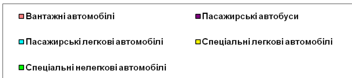
Рис. 2. Викиди шкідливих речовин в атмосферу від окремих видів автотранспорту в м. Ковелі середнє за 2013-2015р.р., %

Перелік шкідливих речовин, які надходять у повітряний басейн міста, піддається обмеженому та низькому контролю, а моніторинг здійснюється тільки міською СЕС [4].