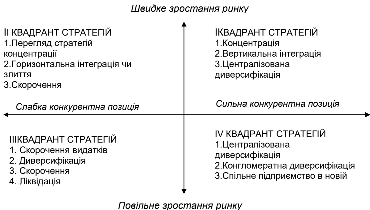
Рис. 3. Матриця вибору стратегії за А. Томпсоном і А. Стрікландом

В роботі доцільно скористатися матрицею вибору стратегії залежно від динаміки ринку продукції і конкурентної позиції підприємства, яку запропонували А. Томпсон і А. Стрікланд (рис.3).