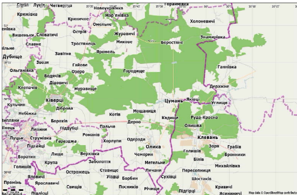
Рис. 1. Картосхема Ківерцівського району за матеріалами ресурсу OpenStreetMap [3]

Природно-ресурсний потенціал району значний. Представлений водними об'єктами: на території району протікає 13 річок [1]: Кормин, Конопелька, Рудка, Прудник, Любка, Грушвиця, Путилівка, Сичівка, Стир, Оснище, Стрипа, Черемозна, СК-1 (права притока р.Конопелька); є 2 озера: Озеро кохання, Озерце, 73 ставки; багато джерел підземних вод – Цуманські джерела, Гор'янівські джерела, Криничка Юрія Переможця, Святе цілюще, Прісне цілюще, Свята криниця, Личансько-Пітушкове, Прилуцьке, Чемеринські джерела. Площа меліорованих земель – 27,180 тис. га, з них осушені сільськогосподарські угіддя – 21,093 тис. га [2]. На території району діє 16 осушувальних систем [5], в т. ч. міжгосподарських – 12 (Жидичинська, Прудниківська, Берестянська, Верхів'я р. Конопельки, Сичівська, Кизлівська, Сильненська, Тростянецька, Вікентіївська, Журавичівська, Годомичівська, Вишеньки - Носачевичівська), внутрішньогосподарських – 4 (Олицька, Грем'яченська, Суська, Холоневичівська). Протяжність відкритої мережі каналів та зарегульованих водоприймачів – 1082,8 км, з них у державній власності – 238,7 км, у комунальній власності – 844,1 км. Кількість гідротехнічних споруд – 1043 од., з них у державній власності – 119 одиниць, а у комунальній власності – 924 од. [4]