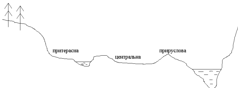
Рис. 2. Схема заплави

Заплава. Тривалість розливу води і його висота залежать насамперед від кількості опадів у басейні річки протягом зими від терміну танення снігу, тривалості вказаного періоду. Висота і тривалість розливу залежать від місцезнаходження заплави (верхня, середня, нижня течія), також від рельєфу. За характером рельєфу, процесів ґрунтоутворення і зволоження заплаву поділяють на 3 частини: прируслову, центральну, притерасну (рис. 2).