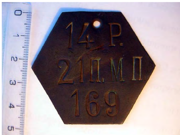
Рис. 1. Жетон солдата 21 піхотного Муромського полку.

березі р. Стир, приблизно за 5 км від Луцька по течії. Виготовлений жетон із латуні. Напис «14 р. 21 П. МП. 169» дозволив ідентифікувати його як такого, що належав солдатів 14 роти, 21 Муромського піхотного полку. Число «169» вказує на особистий номер солдата-власника. Напис читається чітко. За розмірами жетон є типовим для даного типу аксесуарів того часу. Він має восьмикутну форму, відстань між нижнім та верхнім ребром становить 47 мм, між бічними – по 44 мм, отвір для мотузки – 3 мм.