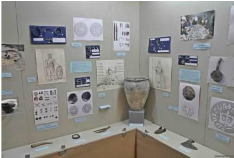
Фото 3. Стенд Шацької експедиції.