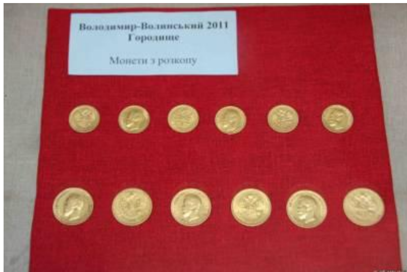
Фото 9. Володимир-Волинський. Монети з розкопу.