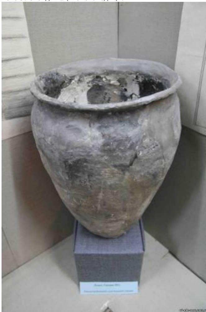
Фото 4. Реконструйована слов'янська посудина.