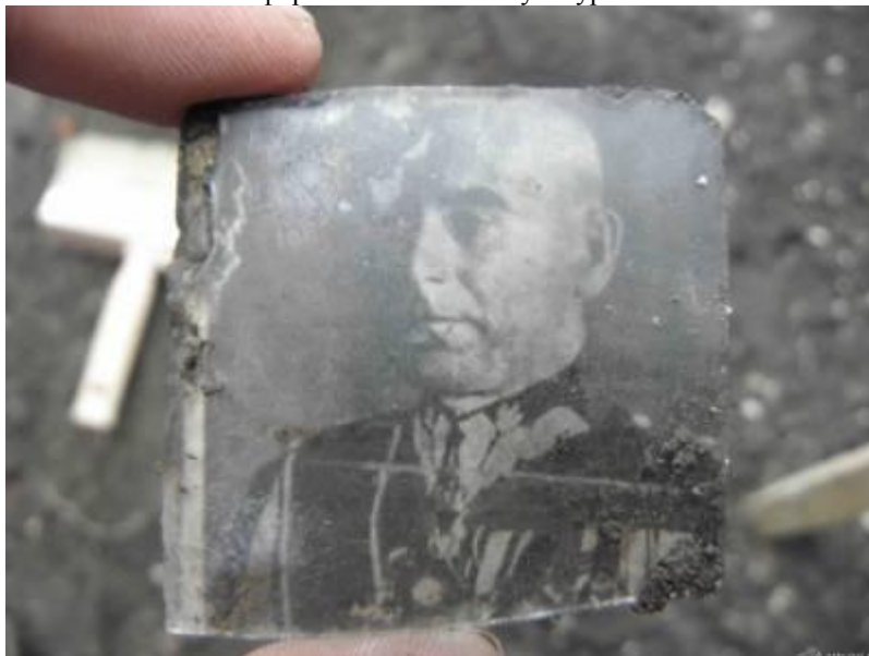
Фото 8. Володимир-Волинський. Фото польського військового.