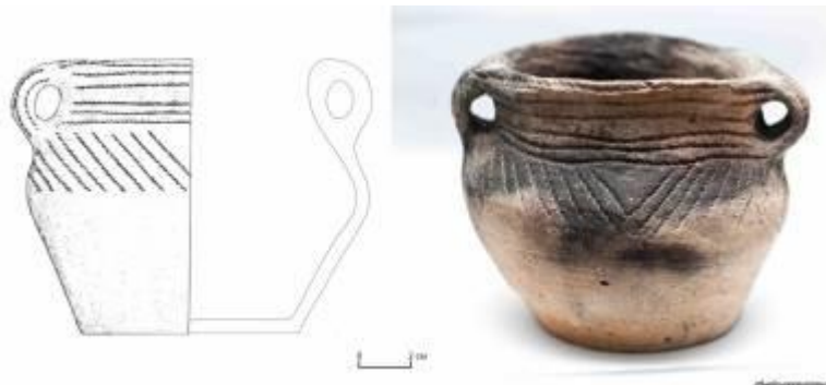
Фото 1. Луцьк: Амфорка стжижовської культури

13. Златогорський О., Вашета М. Результати дослідження в с. Пересопниця 2011 р. / АДУ 2011 (у друці).