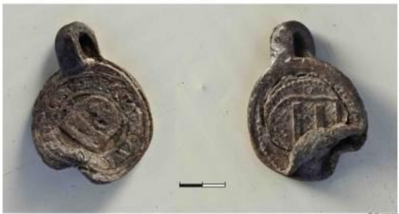
Фото 5. Богушівка. Торгова пломба м. Цвіккау.