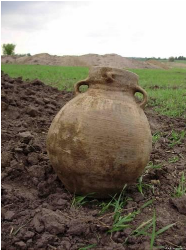
Фото 7. Шепель. Амфора стжижовської культури.