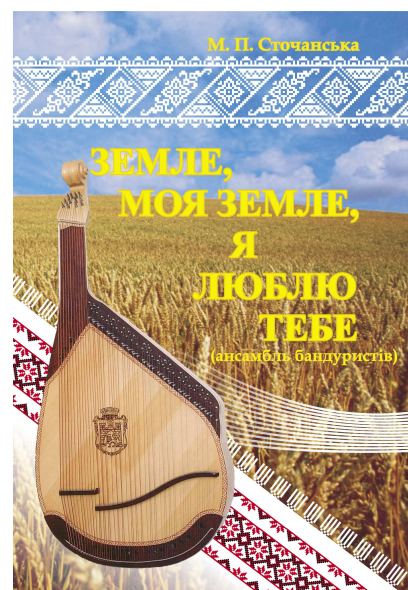
2009 р. (22 ансамблеві партитури, CD)