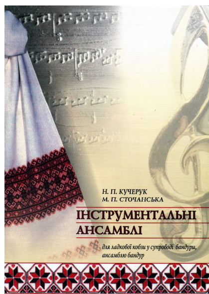
2005, 2006 рр. (5 ансамблевих партитур)