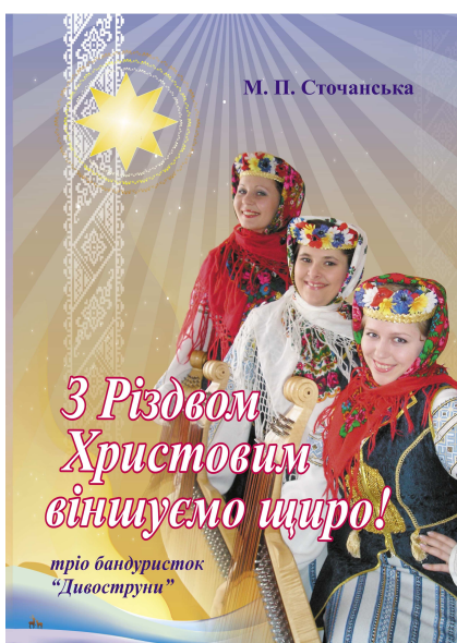
2011 р. (10 ансамблевих партитур, CD)