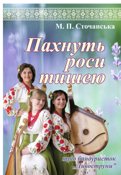
2011 р. (12 ансамблевих партитур, CD)