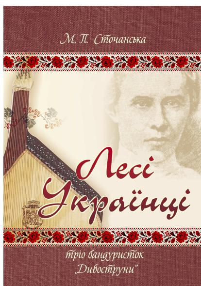
2011 р. (10 ансамблевих партитур, CD)