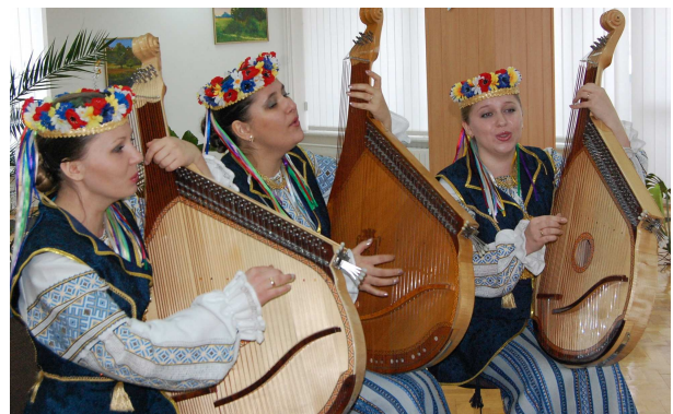
Вітаємо з жіночим святом 8 Березня працівниць Волинського університету (зал бібліотеки ВНУ ім. Лесі Українки, 2010 р.)