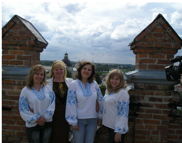
Знімається музичний фільм “Земле, моя земле, я люблю тебе” на вежі Луцького замку. Волинське телебачення (Луцьк, 2011 р.)