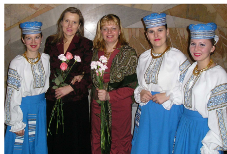
Із заслуженим діячем мистецтв України, доцентом Львівської національної музичної академії імені М. В. Лисенка, композитором О. Герасименко (Київ, 2006 р.)