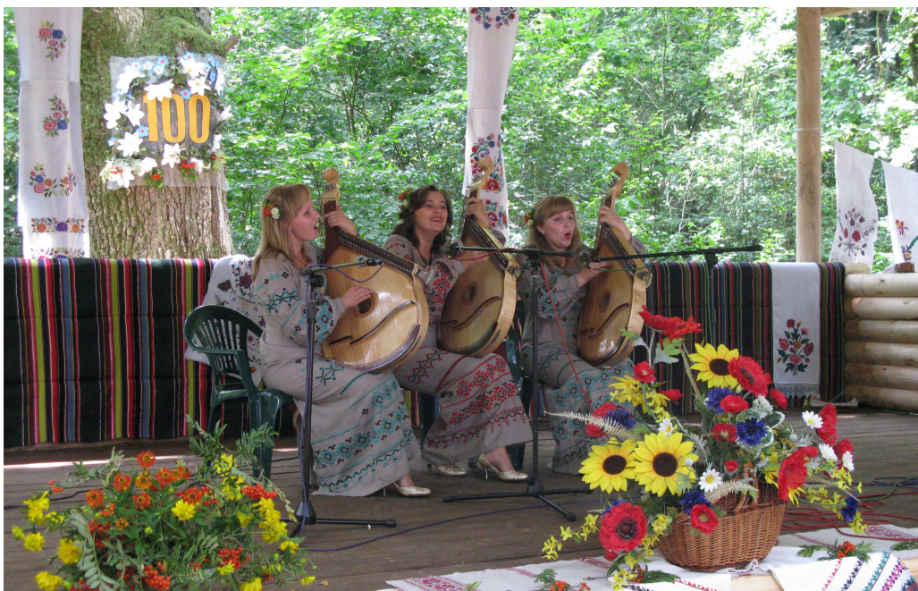
На святковій сцені (оз. Нечимне, 2011 р.)