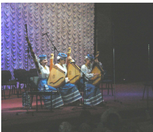
Голова журі II Міжнародного конкурсу кобзарського мистецтва імені Г. Китастого – народний артист України, професор В. Єсипок вручає високу нагороду “Дивострунам” – Диплом лауреата I премії (Київ, Український дім, 2006 р.)