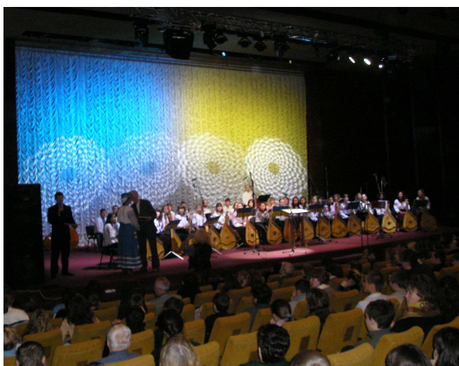
На концерті переможців II Міжнародного конкурсу кобзарського мистецтва імені Г. Китастого (Київ, Український дім, 2006 р.)