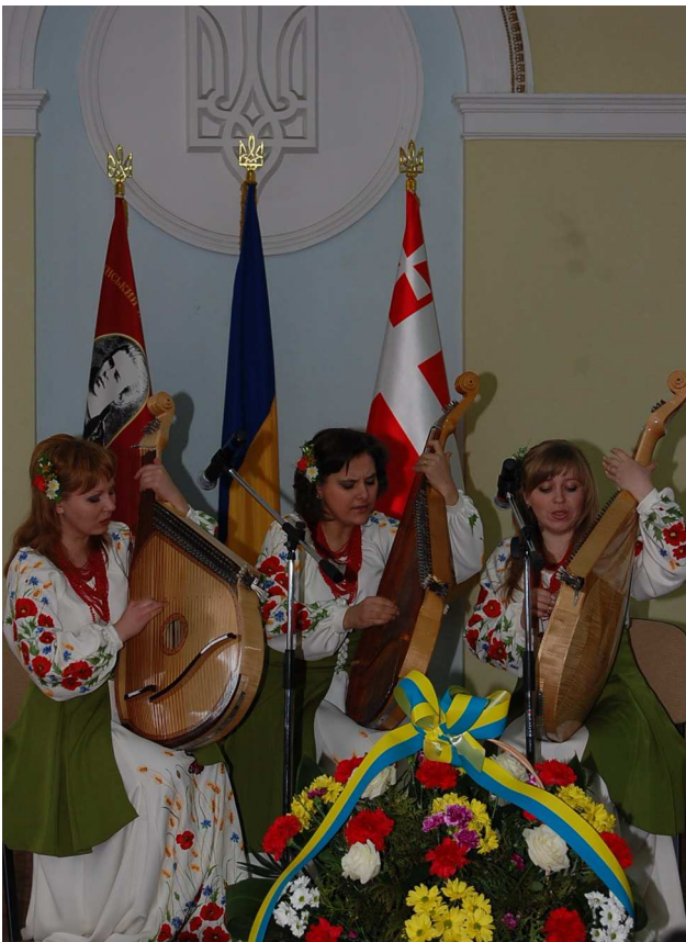
На урочистій академії до 140-ї річниці від дня народження Лесі Українки (актовий зал ВНУ ім. Лесі Українки, 25 лютого 2011 р.)