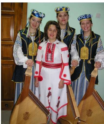
Із заслуженою артисткою України Г. Топоровською (Луцьк, 2007 р.)