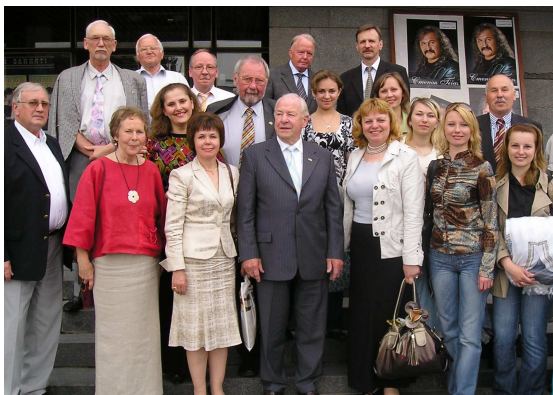
Із членами спілки "Мости в Україну" після концерту творчих колективів ВНУ ім. Лесі Українки (Луцьк, обласний музично-драматичний театр імені Т. Шевченка, 2010 р.)