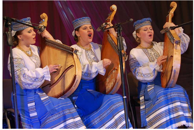
Прем'єра пісні "Пахнуть роси тишею" (вірш О. Богачука). Вітання з 70-літнім ювілеєм Волинської організації Національної спілки письменників України (Луцьк, 2010 р.)