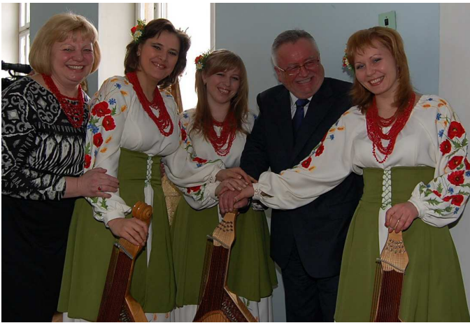
Із головою Волинської обласної державної адміністрації Б. П. Клімчуком на урочистості в університеті (25 лютого 2011 р.)