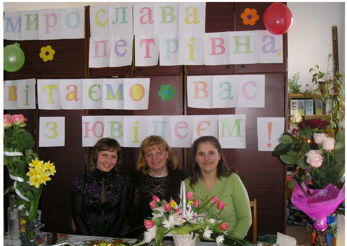
Із учасницями тріо "Дивоструни" у класі бандури інституту мистецтв (2008 р.)