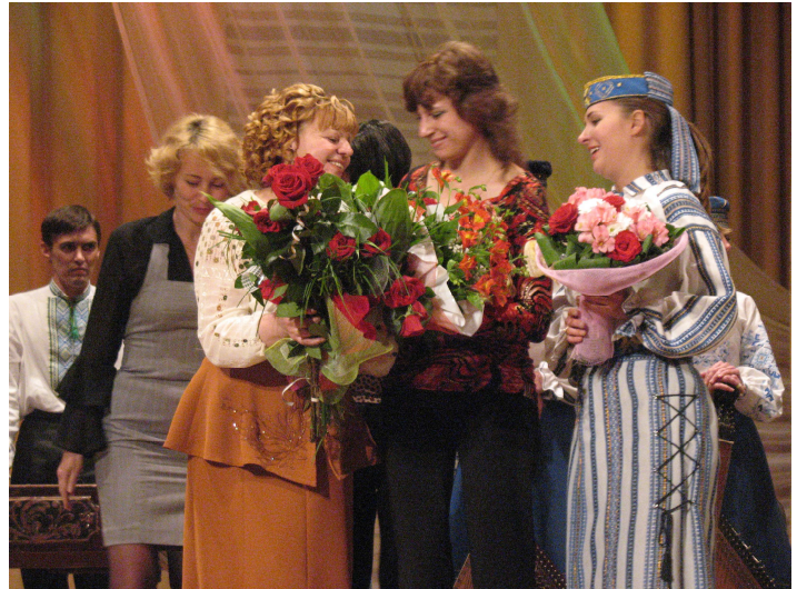
Вітання від випускників класу бандури ВНУ ім. Лесі Українки на творчому вечорі (Палац культури м. Луцька, 2009 р.)