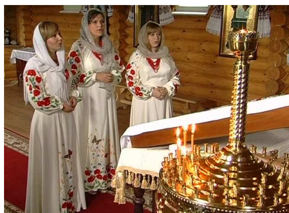
У храмі Ікони Холмської Божої Матері. Знімається музичний фільм “Молитва за Україну”. Волинське телебачення (Луцьк, 2011 р.)