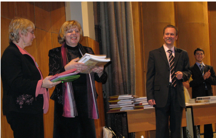
Вітання від Волинського університету імені Лесі Українки голові оргкомітету, заслуженій артистці Росії, професорові РАМ імені Гнесіних Л. Жук, членам журі та учасникам III Міжнародного конкурсу виконавців на багатострунних інструментах імені В. Городовської (Москва, Великий зал Російської академії музики імені Гнесіних, 2008 р.)