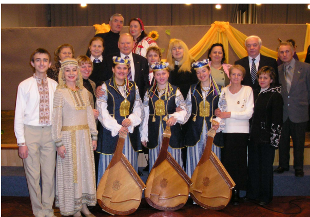
Із головою Волинського братства, академіком М. Жулинським та членами Волинського братства (Київ, 2008 р.)