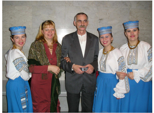
Із народним артистом України, головою правління Національної спілки кобзарів України професором В. Єсіпком (Київ, Український дім, 2006 р.)