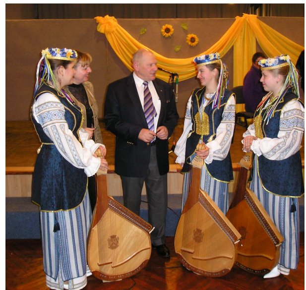
Із академіком Миколою Жулинським на Радіо “Культура” (Київ, 2008 р.)