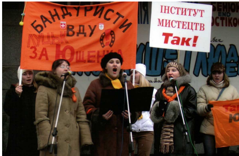
Ансамбль бандуристів “Дивоструни” з концертним виступом на Театральному майдані під час Помаранчевої революції (Луцьк, 2 грудня 2004 р.)