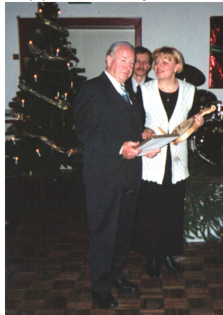
Українська бандура в дарунок професору К.-Г. Крогу (Бад-Зальцфлен, Німеччина, 2003 р.)