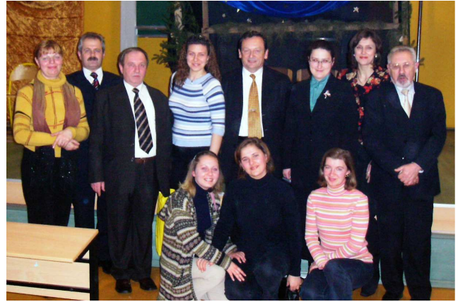
Із ректором Вищої технічної школи, професором Ю. Зайонцем, проректорами Б. Фалдою, З. Гардзінським та делегацією Волинського державного університету імені Лесі Українки (Польща, Холм, 2005 р.)