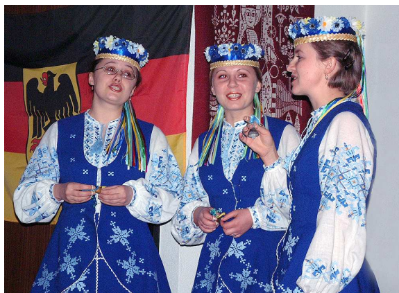
“Українське Різдво” для німецького телебачення (Німеччина, Детмольд, 2001 р.)