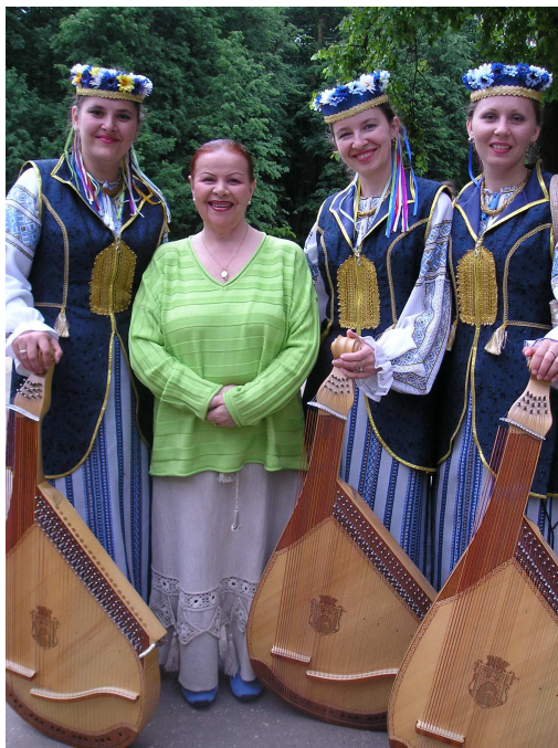
Із народною артисткою Росії, професором Московського державного університету культури і мистецтв О. Стрельченко (Росія, Москва, 2008 р.)