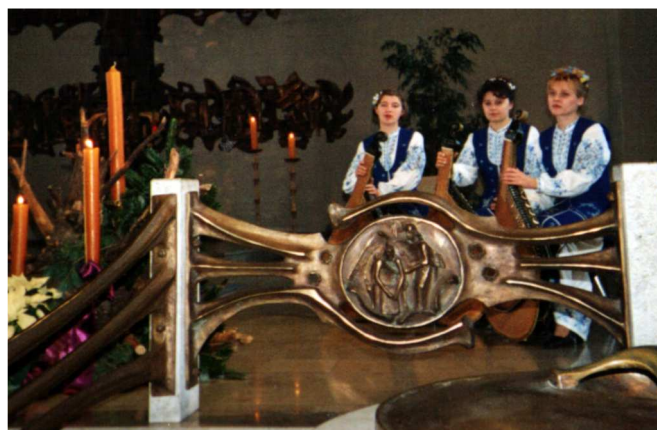
На Службі Божій у костелі (Німеччина, Бад-Зальцфлен, 2001 р.)