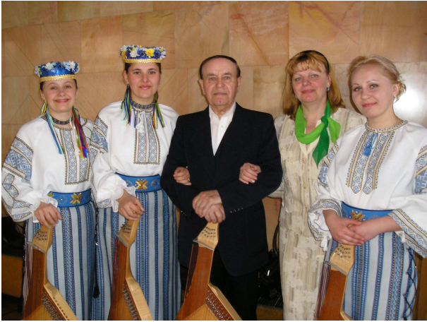
Із головою Волинської обласної організації Національної ліги українських композиторів, заслуженим діячем мистецтв України М. Стефанишином (Луцьк, Облмуздрамтеатр ім. Т. Шевченка, 2006 р.)