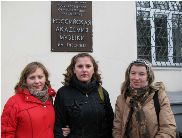
Перед виступом на конкурсних змаганнях у Російській академії музики ім. Гнесіних (Росія, Москва, 2008 р.)