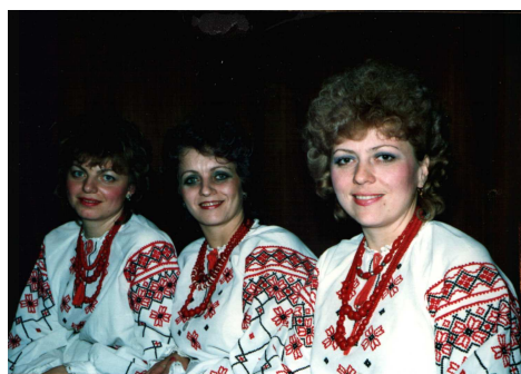
Тріо бандуристок Луцького дому “Просвіта” на міжнародному фестивалі “Живе Різдво” (Австрія, Відень, 1990 р.)