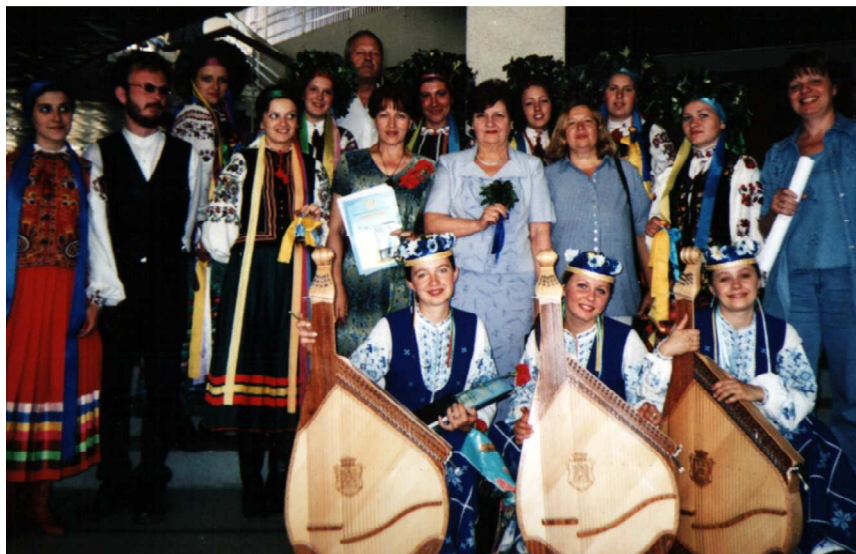
Волинська делегація на II Всеукраїнському мистецькому фестивалі “Просвіта” (Київ, 2003 р.)