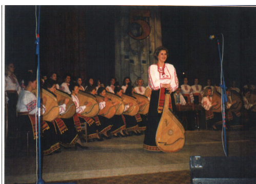
Капела бандуристів “Дивоструни” на урочистому концерті з нагоди створення Волинського державного університету імені Лесі Українки (Луцьк, Облмуздрамтеатр ім. Т. Шевченка, 1993 р.)