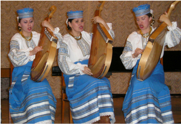
Виступ на конкурсних заганнях II Міжнародного конкурсу кобзарського мистецтва ім. Г. Китастого (Київ, Будинок вчених, 2006 р.)