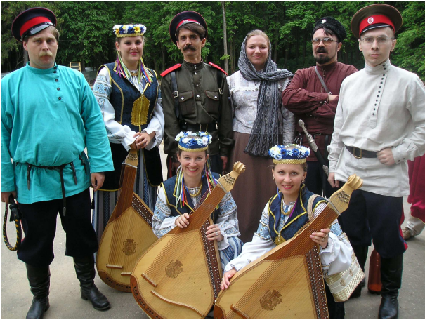
Із кубанським ансамблем народної пісні на I Відкритому фестивалі народного мистецтва (Росія, Красногорськ, 2008 р.)