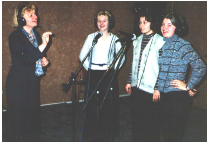
У студії звукозапису ВДУ ім. Лесі Українки (Луцьк, 2000 р.)