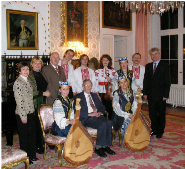
Із принцом краю Ліппе Арміном, пастором М. Мьоллером та ансамблем "Джерела" під час аудієнції в замку (Німеччина, Детмольд, 2007 р.)