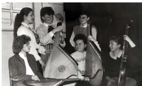
Квінтет бандуристок “Дивоструни” готується до участі у I Всеукраїнському конкурсі бандуристів педагогічних вузів України (Луцьк, 1992 р.)