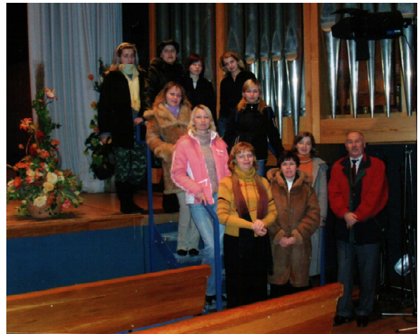
Ансамбль бандуристок “Дивоструни” у Детмольдській консерваторії (Німеччина, 2005 р.)