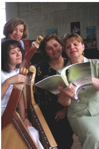
Перше видання посібника класу бандури у ВДУ ім. Лесі Українки (Луцьк, 2005 р.)