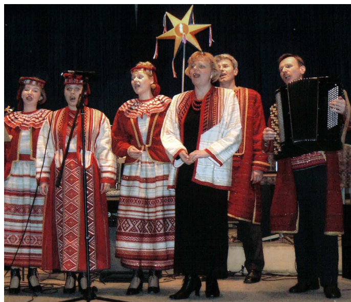
Українські колядки для німецької публіки (Німеччина, Герфорд, 2002 р.)