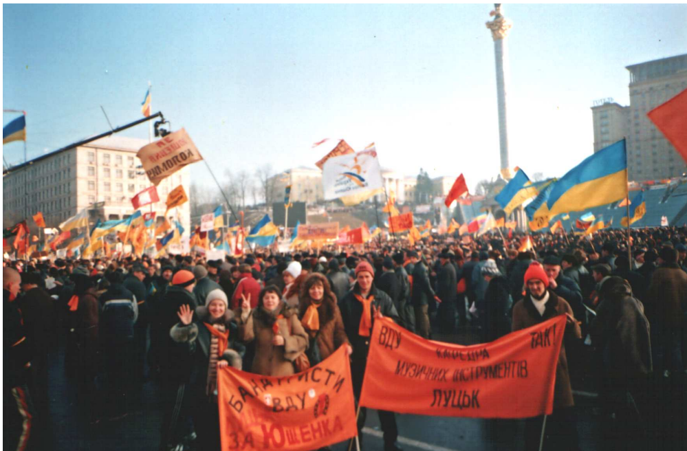
Тріо “Дивоструни” на майдані Незалежності під час Помаранчевої революції (Київ, 2–5 грудня 2004 р.)