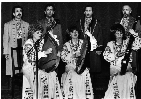
Тріо бандуристок Луцького дому “Просвіта” та чоловічий вокальний квартет Луцького педагогічного училища (Луцьк, Облмуздрамтеатр ім. Т. Шевченка, 1990 р.)