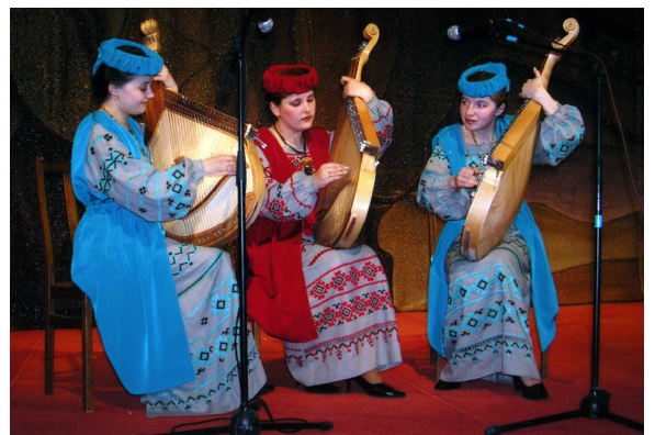
На звіті композиторів Волині (Луцьк, Облмуздрамтеатр ім. Т. Шевченка, 2005 р.)