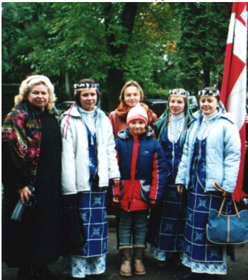
Делегація Волинського державного університету імені Лесі Українки на XII Гуцульському фестивалі (Косів, 2002 р.)