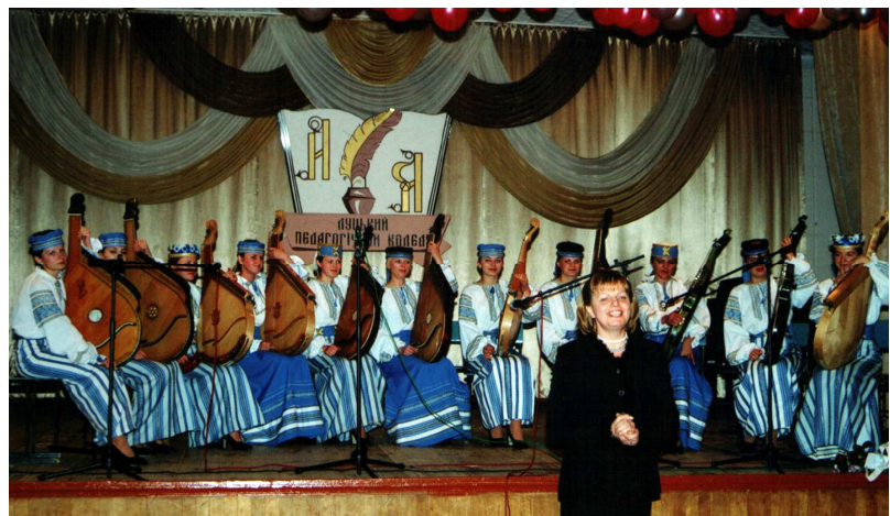
Ансамбль бандуристів “Дивоструни” на відкритті ІІ Всеукраїнського конкурсу “Волинський кобзарик” (Луцьк, 2005 р.)