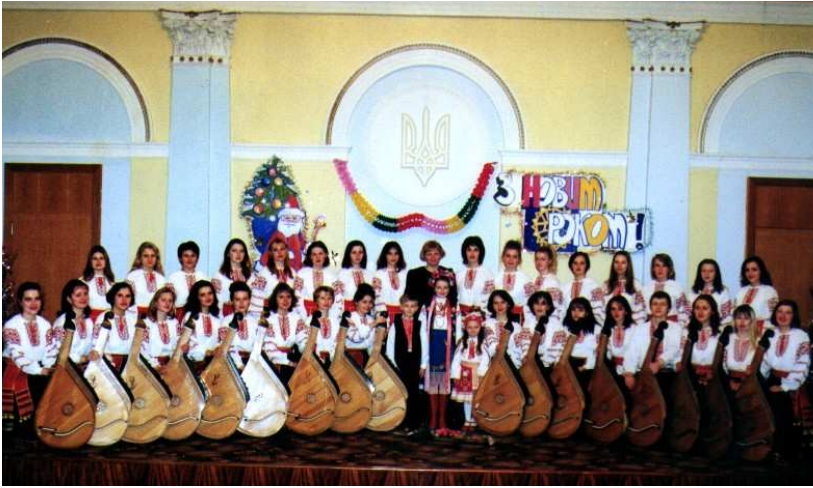
“Різдвяні вечори Інституту мистецтв”. Капела бандуристів “Дивоструни” з юними солістами. (ВДУ імені Лесі Українки, 2000 р.)