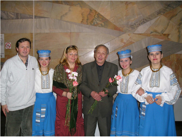
Із народним артистом України, професором Київської національної музичної академії ім. П. Чайковського С. Баштаном та заслуженим діячем мистецтв України В. Курачем (Київ, 2006 р.)