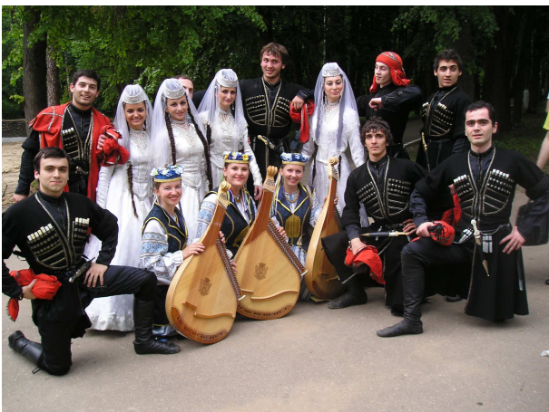
З ансамблем "Колхида" після виступів у гала-концерті (Росія, Красногорськ, 2008 р.)