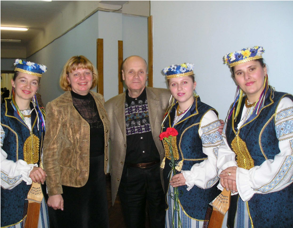
Із лауреатом Шевченківської премії, українським письменником М. Слабошпицьким (Київ, 2008 р.)