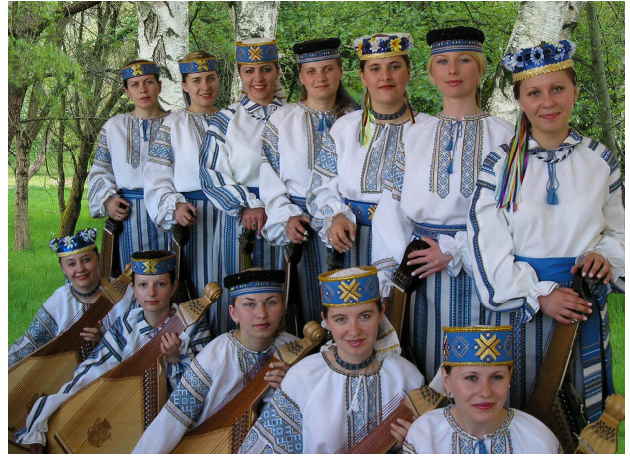
Ансамбль бандуристок "Дивоструни" (2006 р.)