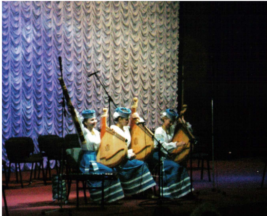
На концерті переможців II Міжнародного конкурсу кобзарського мистецтва ім. Г. Китастого (Київ, Український дім, 2006 р.)