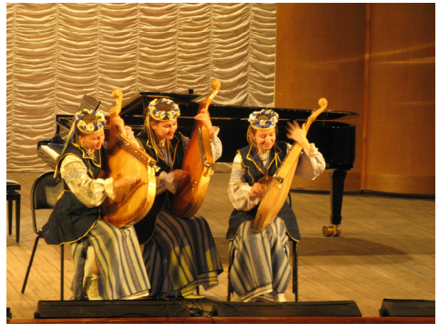
Виступ на концерті "Струны мира" (Росія, Москва, великий зал РАМ ім. Гнесіних, 2008 р.)