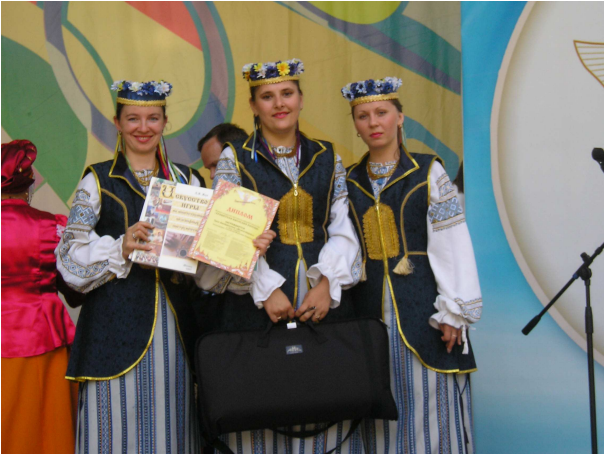
Із високою нагородою – Дипломом володаря Гран-прі I Відкритого фестивалю народного мистецтва “Хранителі національного насліддя” (Росія, Красногорськ, 2008 р.)