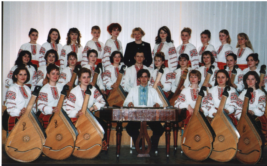
Капела бандуристів “Дивоструни” на сцені інституту мистецтв (2002 р.)