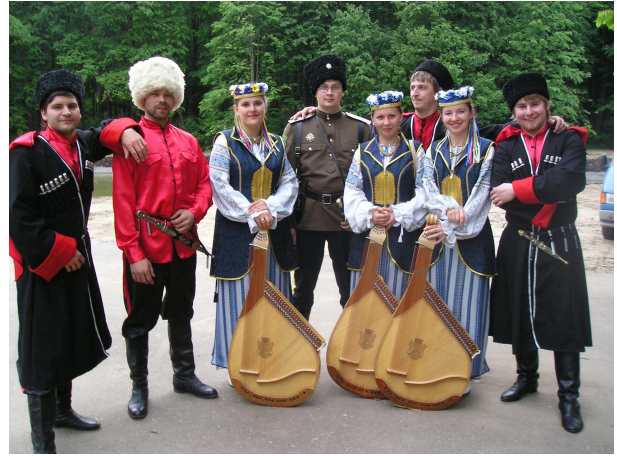
Із чоловічим козачим ансамблем Московського інституту музики ім. А. Шнітке (Росія, Красногорськ, 2008 р.)