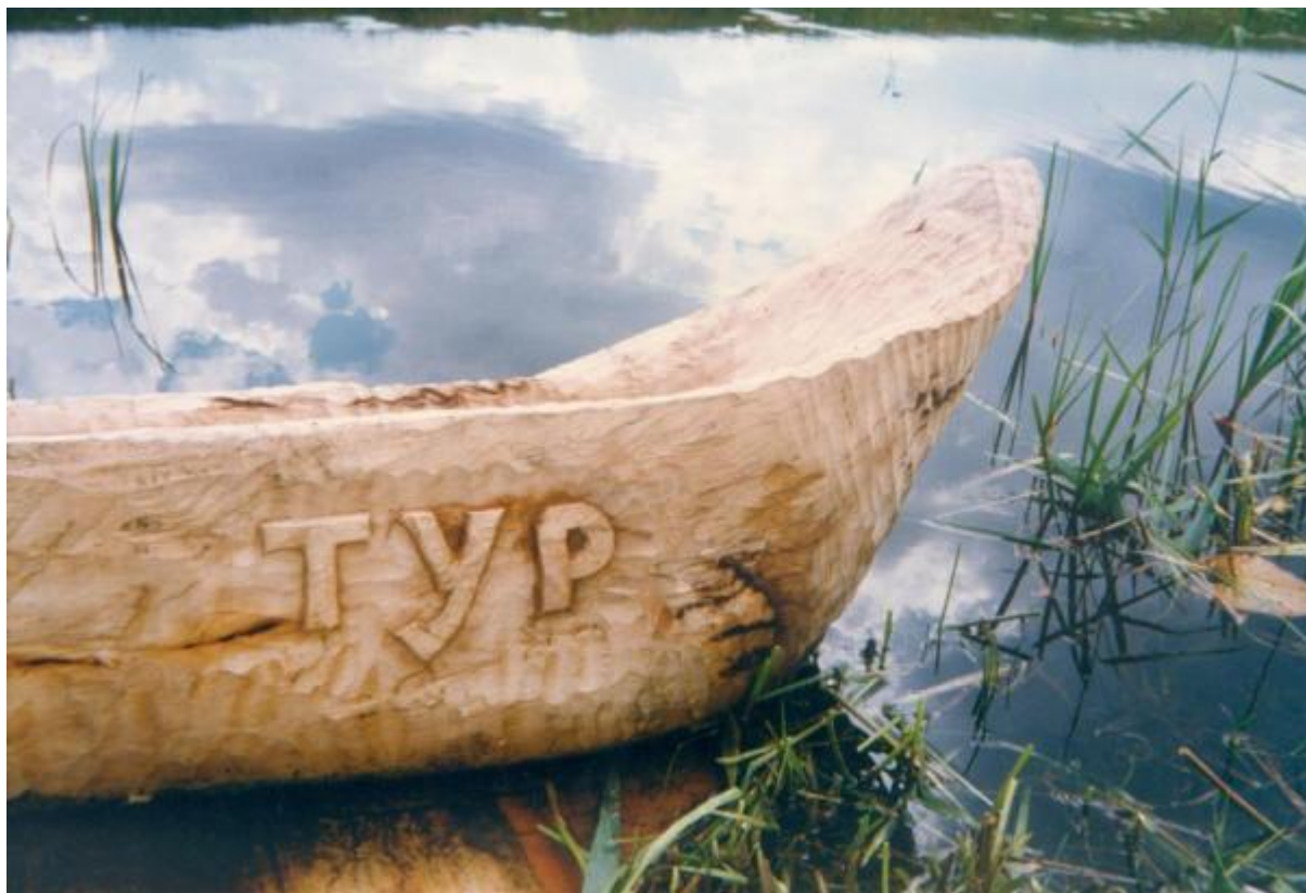
Ком'яга «Тур» на плаву експедиції «Прип'ять 1995»