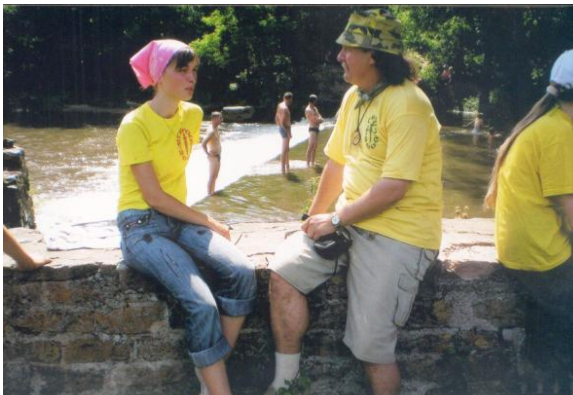
Під час експедиції «Ягілка 2006»