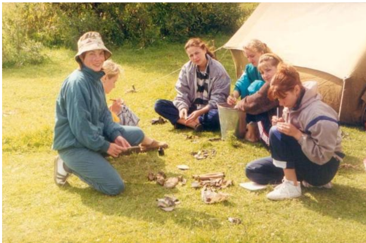
Археологічні артефакти з урочища Гори 1998 р.