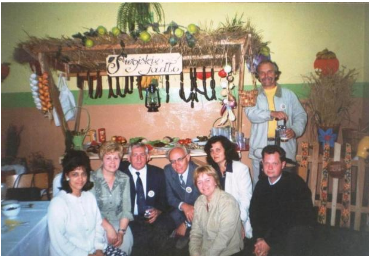
У складі української делегації на Кольбергівських читаннях в м. Пшесусі у Польщі 2001 р.