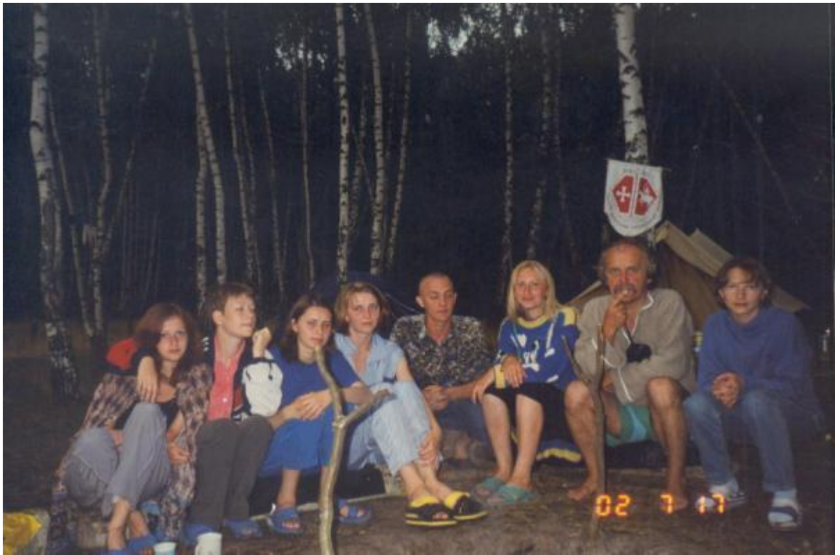
Під час експедиції «Сверинь 2002» на Білому озері в Любешівському районі