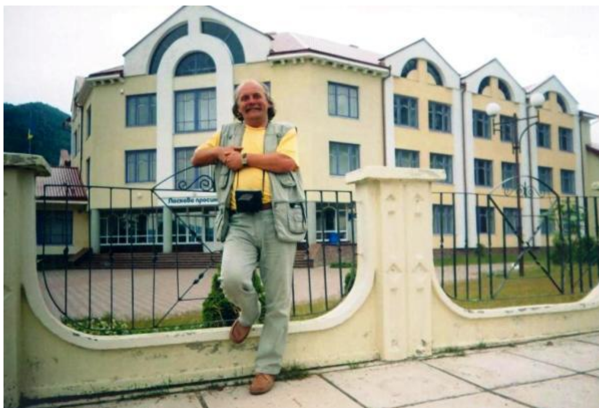
Біля президентської школи в Гуті Богорочанського району 2004 р.