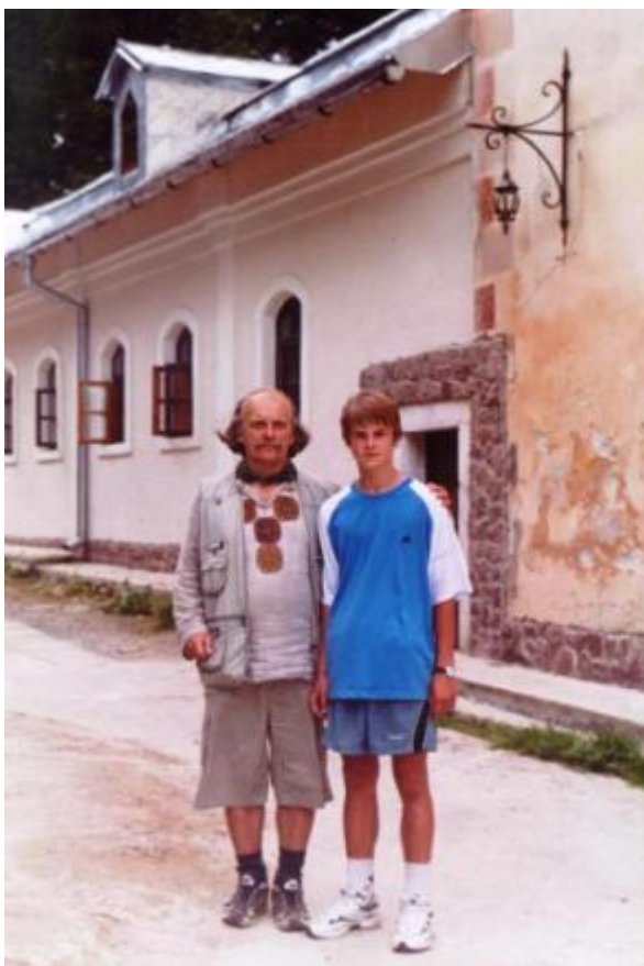
В Манявському скиті з сином 2004 р.