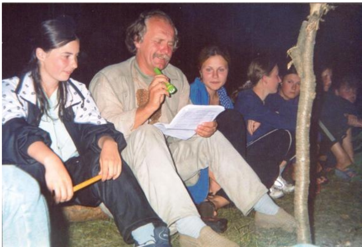
Вечір поезії під час експедиції «Охнич 2003»