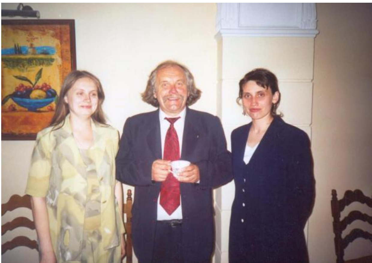
З новозахищеними кандидатами наук у спеціалізованій раді Львівського національного університету