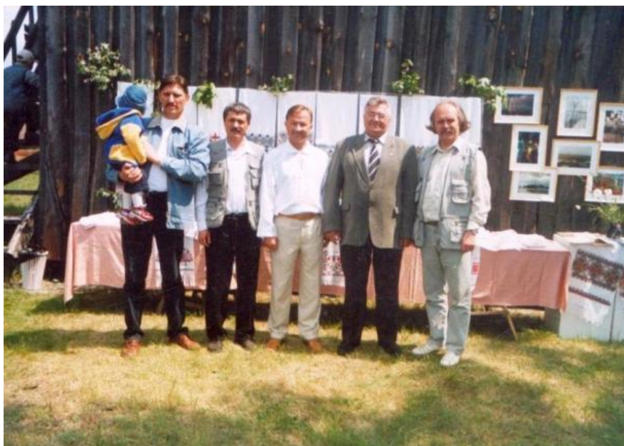
На науковій конференції «Куста то є Тріця»