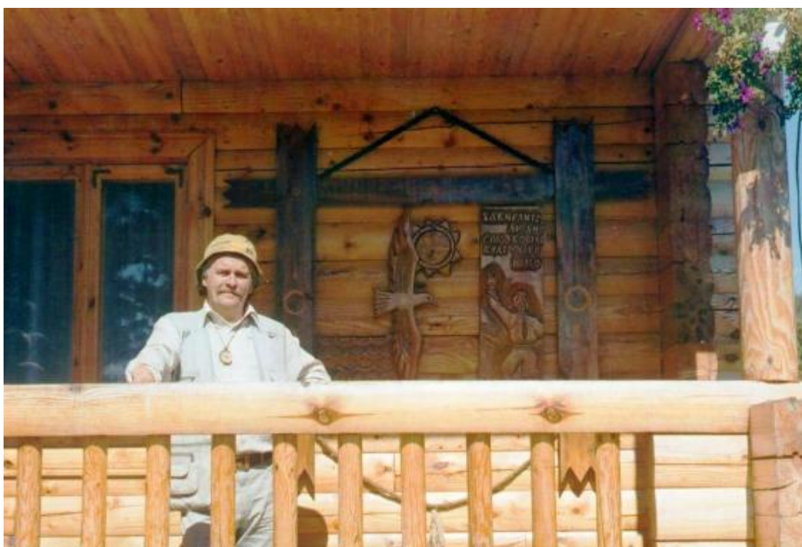
В Троянівці біля свого панно