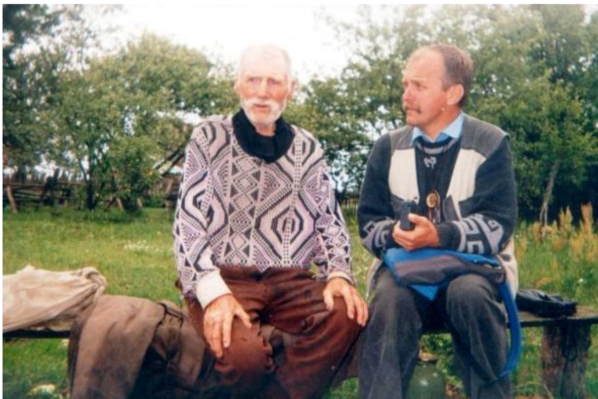
Під час експедиції «Майдан 2000» в с. Великі Телковичі