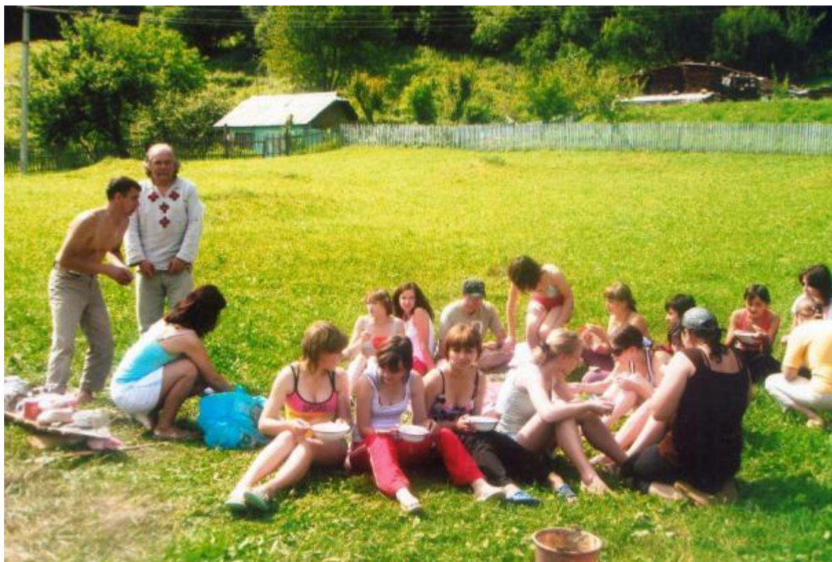
Обід в експедиції 2008 р.