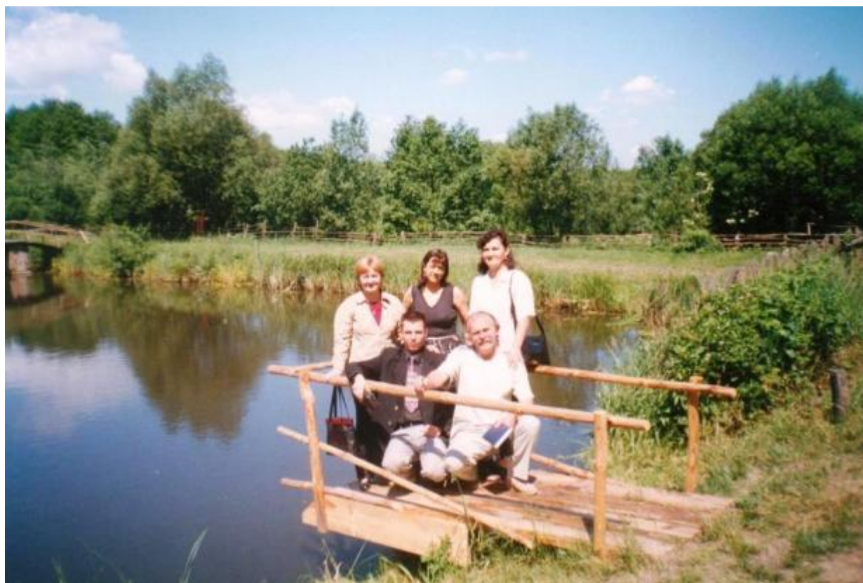
У Скансені в Радомі (Польща)