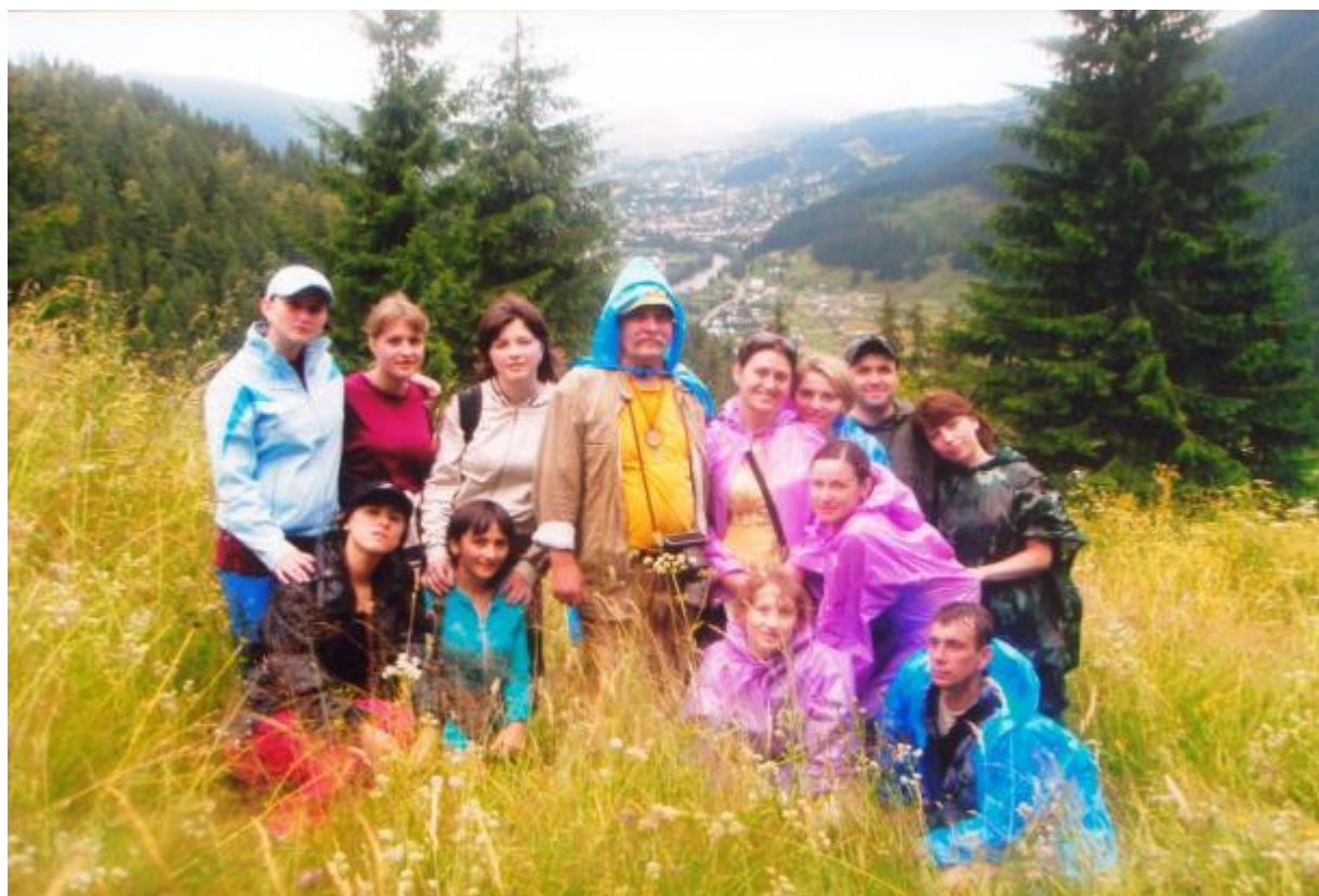
По дорозі до Писаного каменя 2008 р.