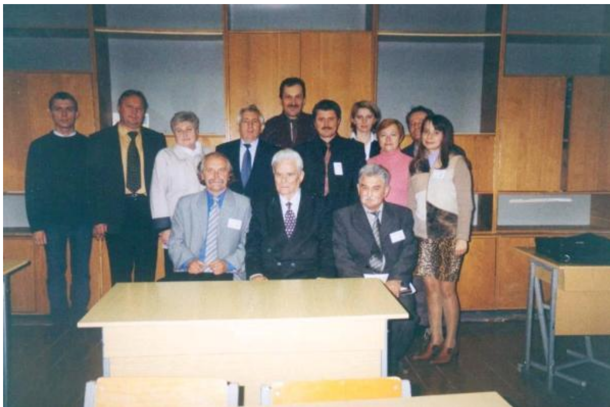
Учасники наукової конференції «Нове життя старих традицій»