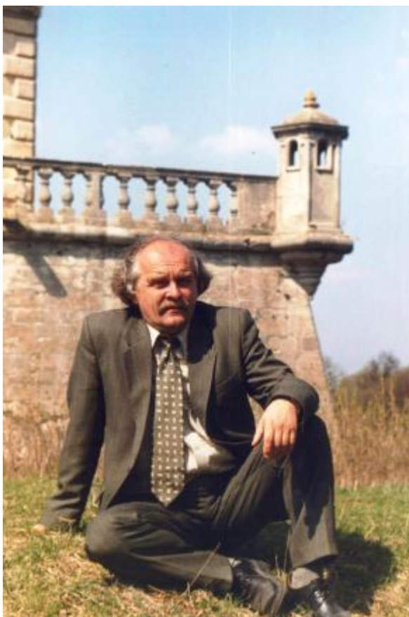
Під мурами Підгорецького замку