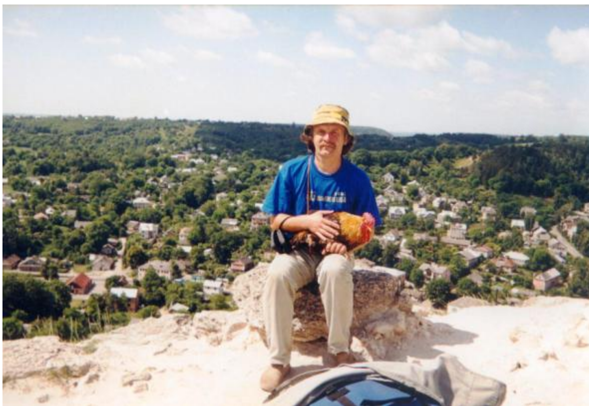
На горі Боні під час експедиції «Волиняна 2003»