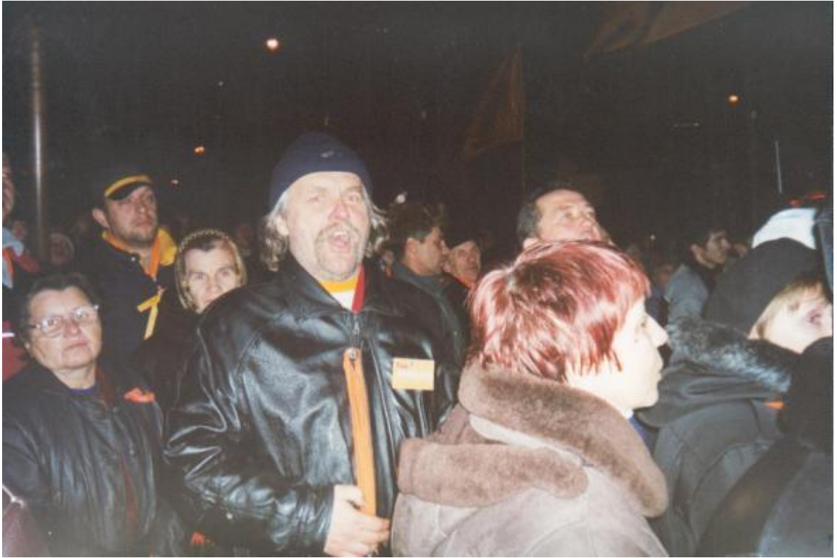
Помаранчева революція, Київ 2004-2005 рр.