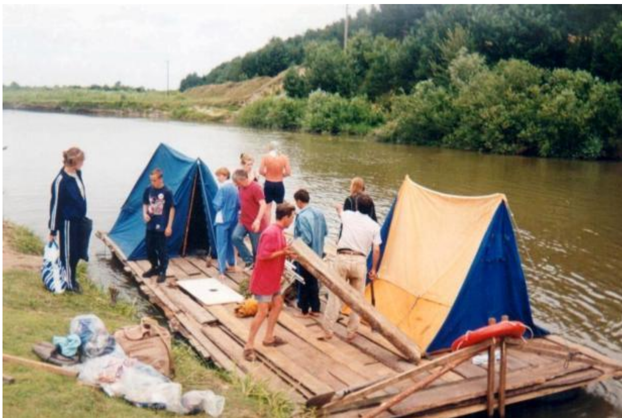
Спуск плота на воду біля Рафалівки. Експедиція «Майдан 2001»