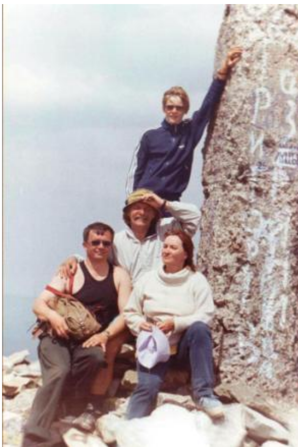
На горі Сивулі 2004 р.