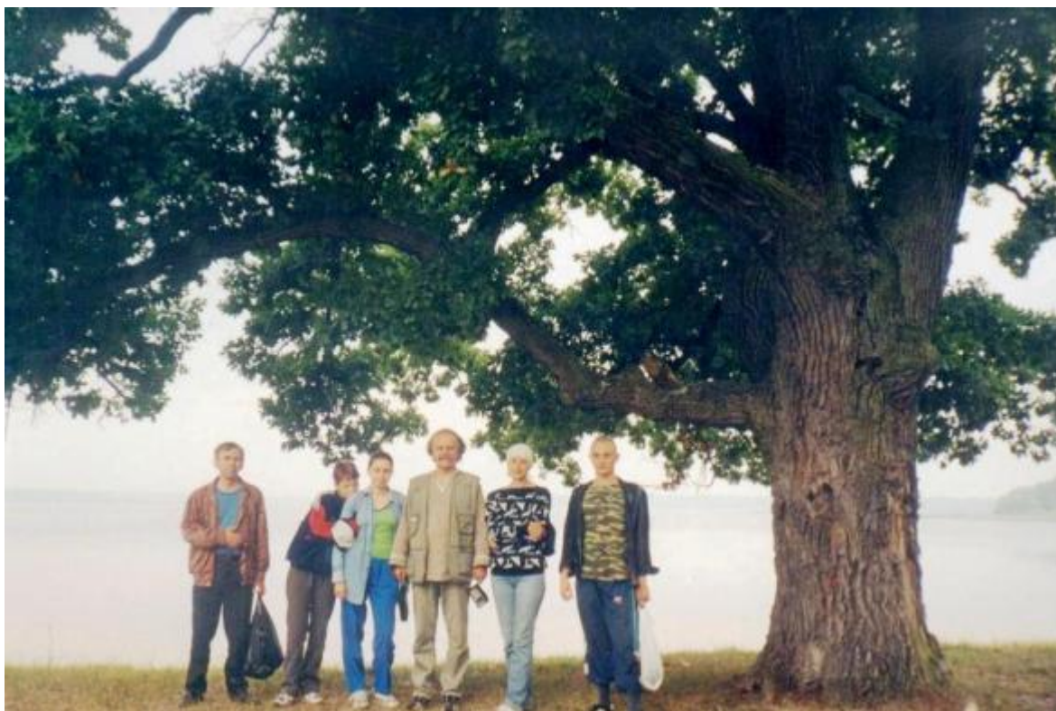
Пішки через державний кордон в Республіку Білорусь