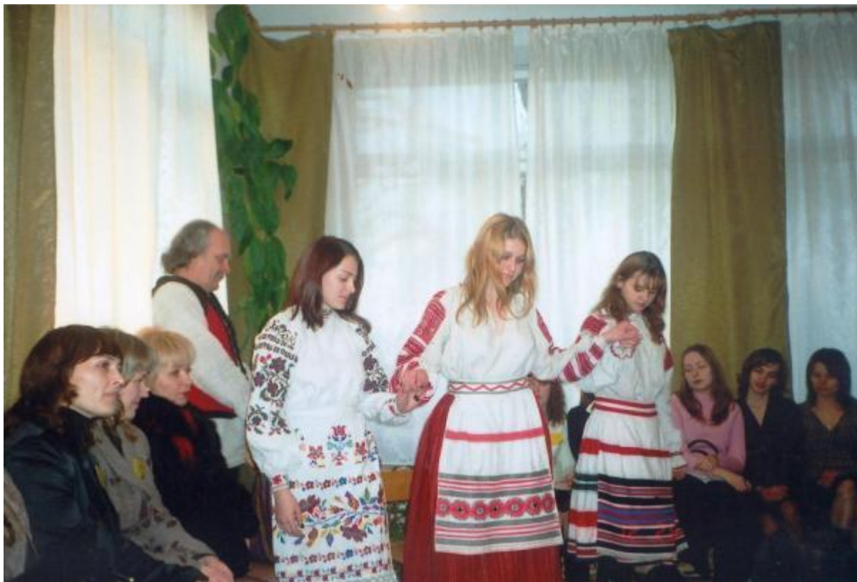
На презентації власної колекції сорочок «Вербовая дощечка» 2006 р.