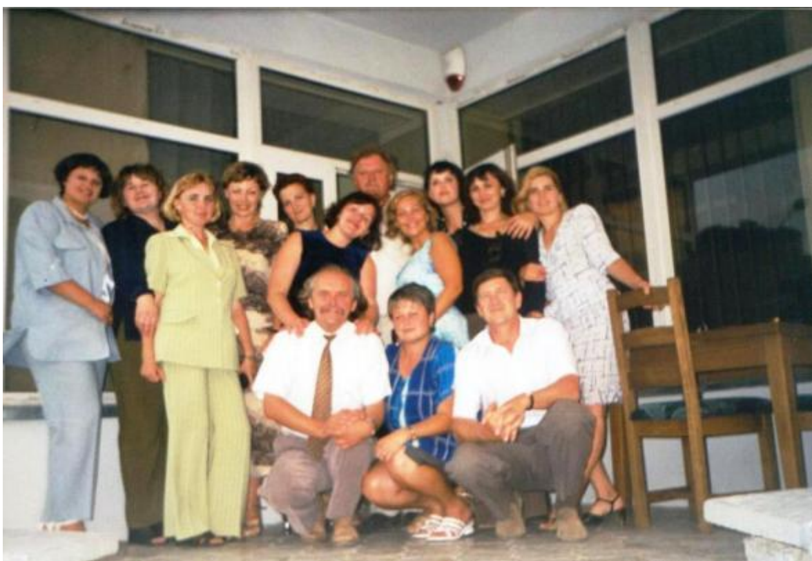
На зустрічі з випускниками