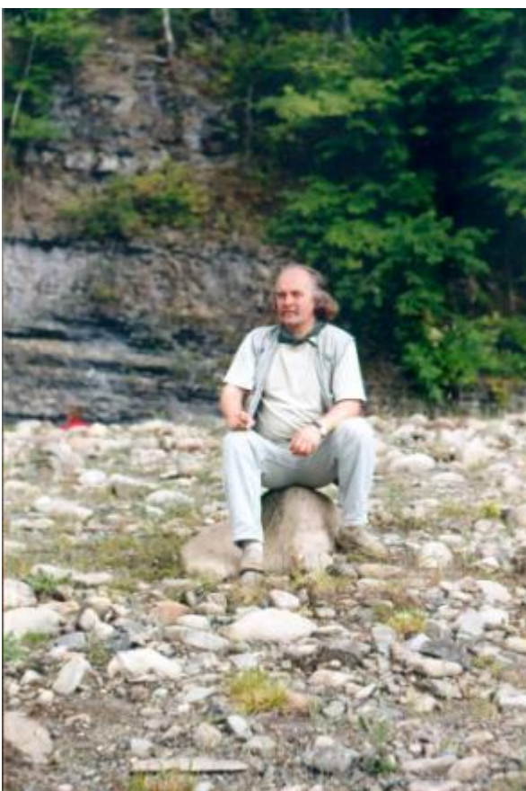
Експедиція «Пороги 2004»