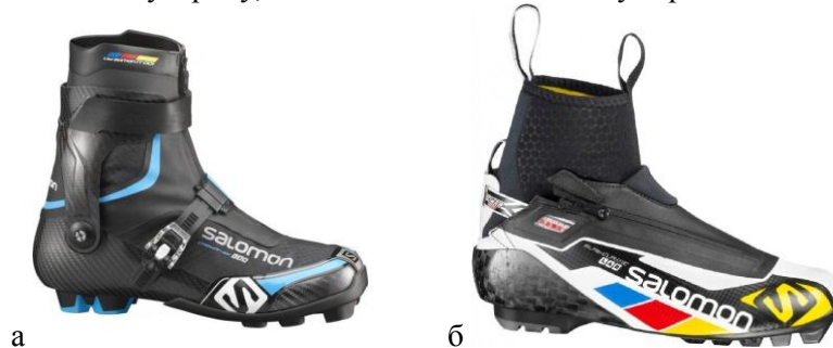
Рис. 3. Гонимые ботинки: а – для конькового хода; б – для классического хода [11]

Фирмой «Salomon», занимающейся разработкой лыжного инвентаря с 1948 г., разработано новое поколение ботинок для системы SNS. В 2015 г. фирма выпустила коньковые ботинки Carbon Skate Lab, имеющие карбоновую монолитную раму, позволяющая снизить массу пары ботинок до 860 грамм (рис. 3).