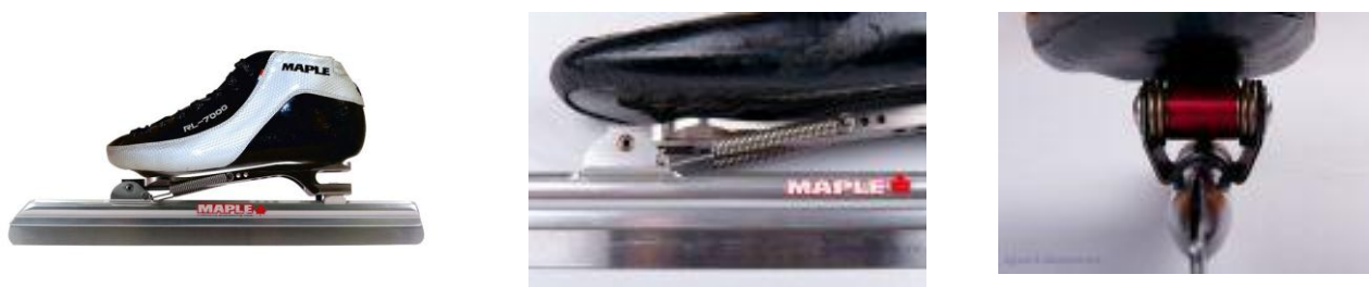
Рис. 1. Конструктивные особенности новых коньков в конькобежном спорте

По сравнению с обычными коньками, они позволили увеличить амплитуду отталкивания за счет удлинения фазы двухопорного отталкивания, уменьшить угол отталкивания при неизменной высоте посадки конькобежца повысить эффективность работающих мышц, благодаря полному выпрямлению толчковой ноги в коленном суставе до снятия конька со льда. Все это в сумме дает преимущество от 0,2 до 0,4 секунды на каждом круге перед выступающими на старых коньках.