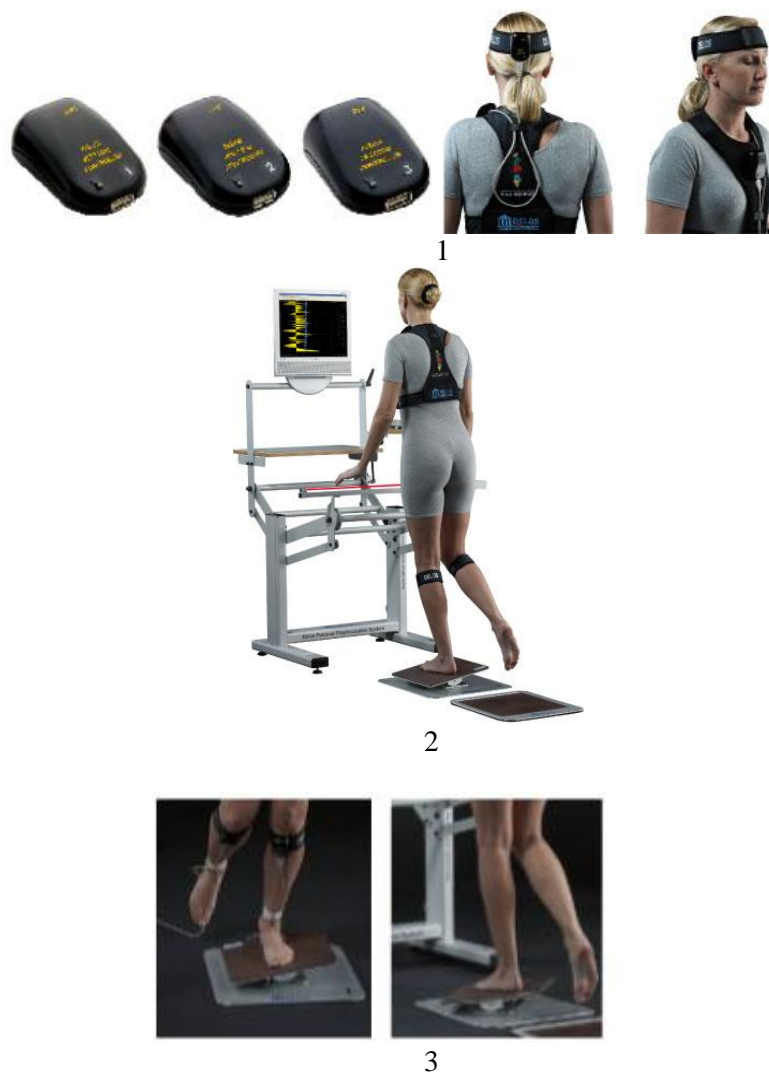
Рис. 7. Система для контроля статической и динамической позы тела человека фирмы «Delos»: 1 – датчик контроля позы; 2 – дополнительное средство по удержанию позы; 3 – платформа равновесия [8]

Гравитационные биомеханические стимуляторы. Исследуя перспективы совершенствования спортивной тренировки, нельзя не заметить практически малоиспользуемые резервы тех направлений современного знания, которые дают нам возможность получить более глубокие представления об энергетике человеческого организма, в частности, о термодинамике и биомеханике. Практическое использование современных достижений этих наук позволяет уже сейчас значительно повысить качество и интенсифицировать тренировочный процесс, а также повысить работоспособность спортсмена [15].