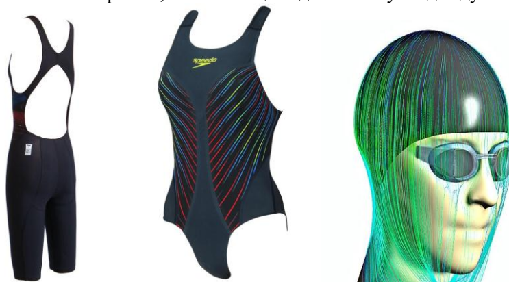
Рис. 5. Скоростные костюмы для пловцов фирмы «Speedo» [12]

Масса спортивной одежды может отрицательно повлиять на показатели спортивной работоспособности в некоторых видах спорта, поскольку, чем тяжелее одежда, тем больше энергии требуется для преодоления дополнительной гравитационной силы. Поэтому создатели спортивной одежды используют современные ткани и материалы, позволяющие сделать такую одежду более легкой.