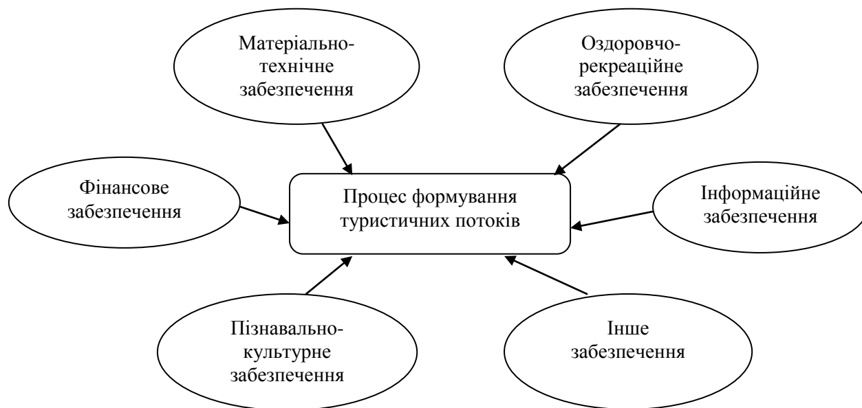
Рис. 1. Складники процесу формування туристичних потоків [6, с. 35]

[10, с. 66]. Процес формування туристичних потоків (рис. 1) можна розглядати як послідовну зміну операцій з розробки маршрутів й обслуговування туристів, а туристичний маршрут – як переміщення групи людей або однієї особи до місця зацікавлення, перебування та повернення до місця проживання [6, с. 32].