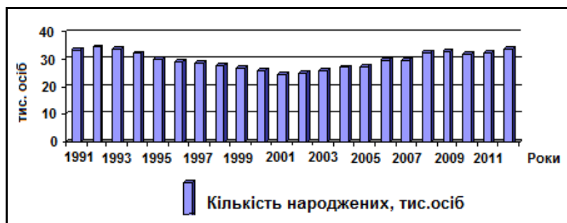
Рис. 1. Динаміка кількості народжених в Північно-Західному економічному районі в 1991–2012 рр.

Для виявлення особливостей динаміки процесу народжуваності в регіоні ми проаналізували часовий проміжок 1991–2012 рр. Орієнтиром було обрано 1992 р., коли в регіоні народилося найбільше за весь період дітей – 34,4 тис. Протягом наступних десяти років кількість народжених поступово скорочувалася, і у 2001 р. народилось лише 24,7 тис. дітей. Від 2001 р. зафіксовано незначне щорічне збільшення народжених, яке тривало до 2010 р., коли незначно знизилася кількість народжених. Проте вже в наступні роки народжуваність знову зростає. У 2012 р. народилося 33 662 немовлят, що на 1345 осіб більше ніж у 2011 р. (рис. 1).